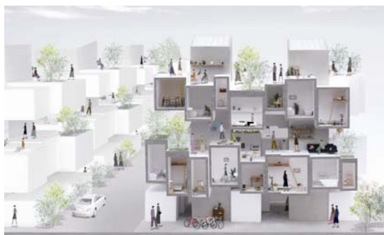
Εικ. 6 Βλ. βιβλιογραφική αναφορά Σημείωσης 9

Το κωμικά ενδιαφέρον είναι ότι όσο λιγοστεύει η –έστω και μουσειακού, περιθωριακού ενδιαφέροντος- επιδεξιότητα του συνθέτη, δηλαδή όσο το αρχιτεκτόνημα προσεγγίζει την απόλυτη ασημαντότητα, αίφνης, τόσο περισσότερο συχνά κάνουν την εμφάνισή τους, από το πουθενά, –ή μάλλον από το φότοσοπ-, ανθρωπάκια, ποδηλάτες, χορευτές, ερωτευμένοι, βιολιστές, σκυλάκια, πουλάκια, γριούλες με παιδάκια και, έτσι, μια παραμυθένια ευδαιμονία του λάιφστάιλ (ευγενικού και κοινωνικά ελεήμονος ως καλού χριστιανού) τα πλημμυρίζει όλα μονομαίας, επιχειρώντας να μετουσιώσει το τίποτα σε κάτι 9 . (Εικόνα 6)