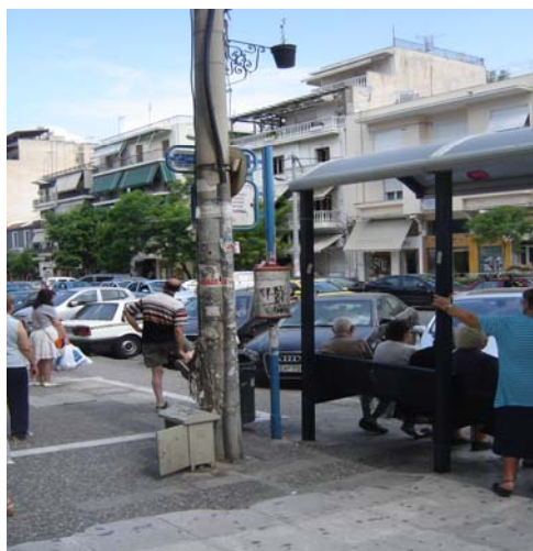
Εικ. 7 Στη στάση με ηλεκτρολογικά, γλάστρα, φουρούσι

Σ' αυτόν, δηλαδή, που τον βιώνουμε σε κάθε μας βήμα (εικόνα 7), δηλαδή: