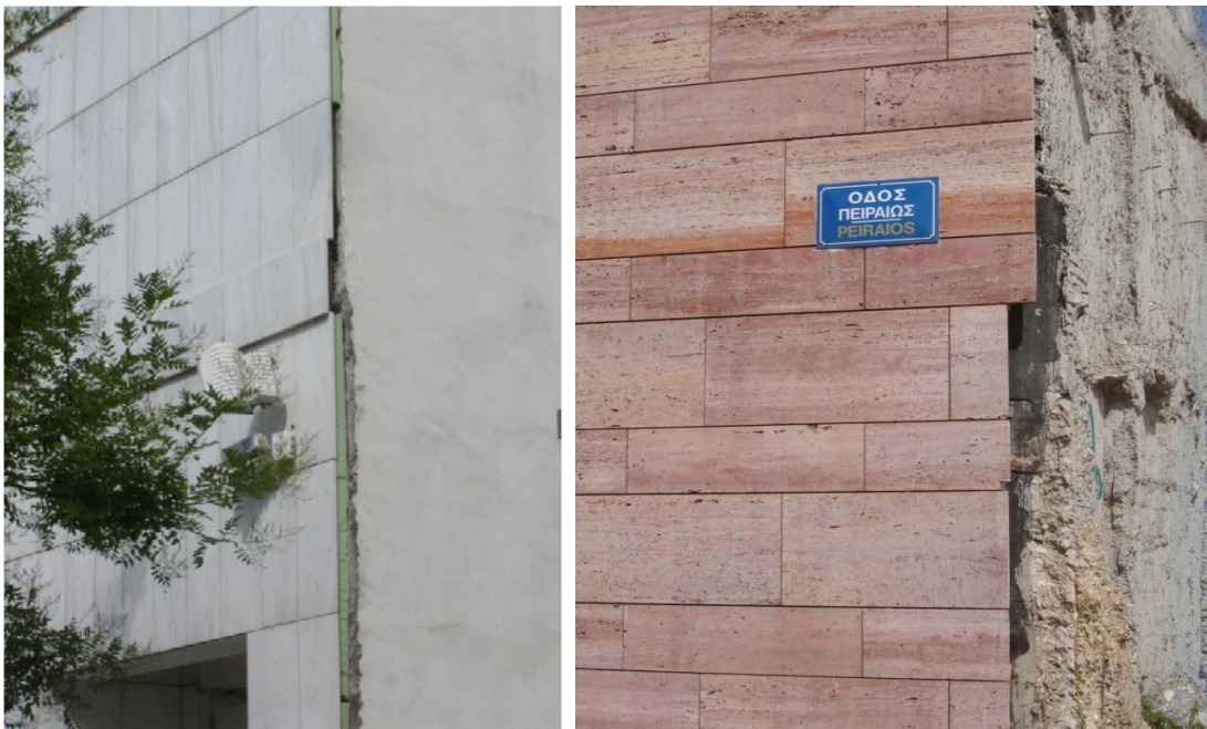
Εικ. 3 Ξενοδοχείο Ledra Marriott και Μουσείο Μπενάκη ομονοούν ως προς τη σχέση τους με το δημόσιο πεδίο

Γεγονός που όχι μόνο δεν αντιστρέφεται ή αντισταθμίζεται, αλλά, αντιθέτως, επιβεβαιώνεται από τις όποιες αποσπασματικές εξωραϊστικές επιδρομές που η κουλτούρα αυτή κατά καιρούς εξαπολύει εναντίον του δημόσιου πεδίου. Επιδρομές που, εν τέλει, επιφέρουν την περαιτέρω ίσχυανση και αδρανοποίησή του 6 . Κυρίως, όμως, επιφέρουν τη συστηματική αποσιώπηση του θεμελιώδους δομικού ρόλου του ως πηγής ικανής να γονιμοποιεί, να εγγυάται και να ρυθμίζει αυθεντικές αρχιτεκτονικές αξίες (Εικόνα 3).