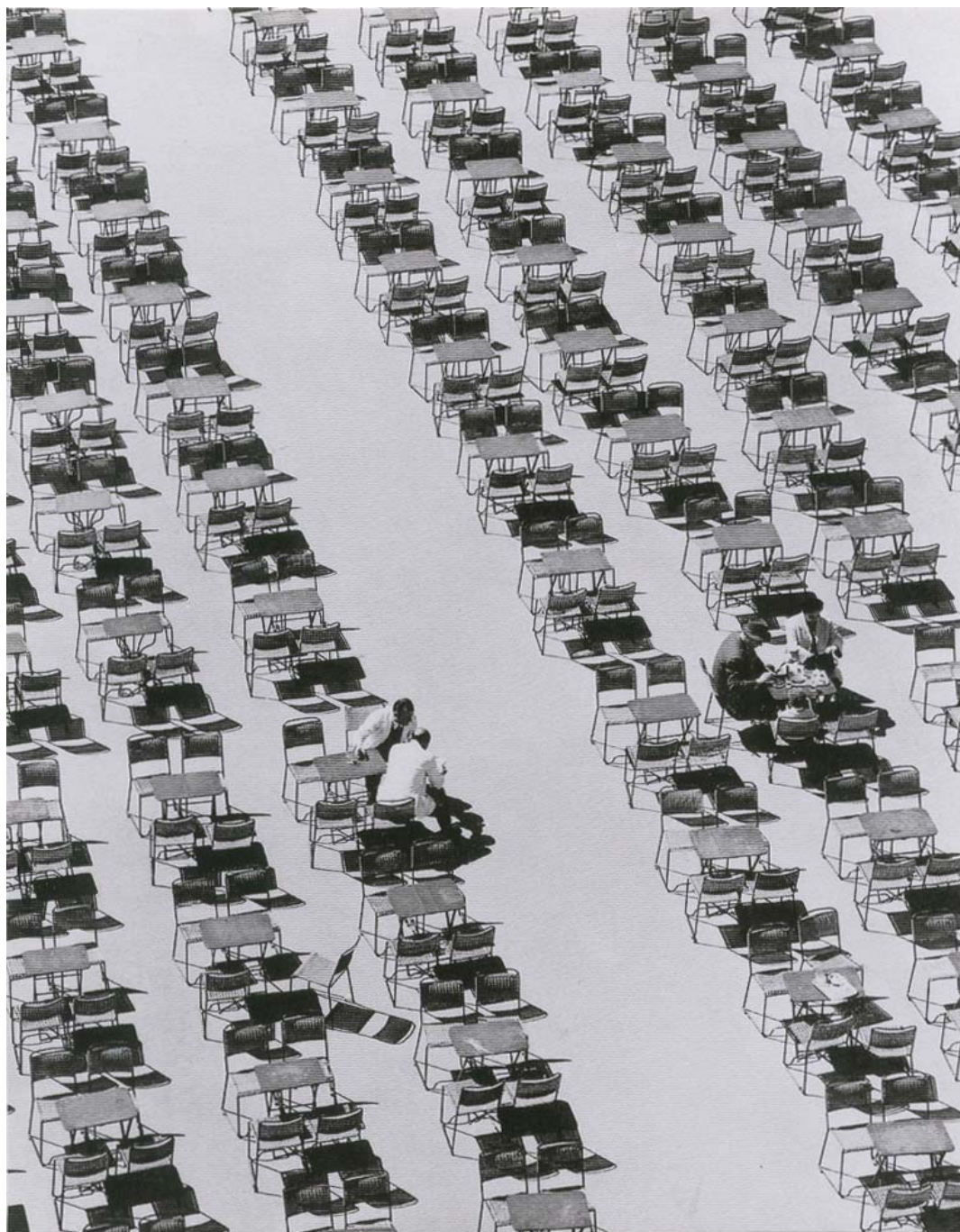
Εικ. 1 Πλατεία Συντάγματος, Ιανουάριος 1956. Πριν από αναπλάσεις, η νηνεμία...

Δύο τρανταχτά παραδείγματα αυτής της κατηγορίας είναι οι σχετικά πρόσφατοι, πολυδιαφημισμένοι και, ήδη, περιπεσόντες σε λήθη αρχιτεκτονικοί διαγωνισμοί για τις αναπλάσεις των πλατειών Ομόνοιας και Συντάγματος (Εικόνα 1).