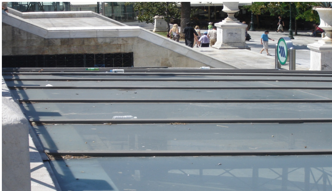
Εικ. 5 Πλατεία Συντάγματος, μετά τις αναπλάσεις. Ποιός τολμά να περπατήσει στο τζάμι για να μαζέψει τα σκουπίδια;

Κάτι τέτοιο, στην καλύτερη και σπανιότερη περίπτωση καταλήγει σ' ένα μουσειακό εγχείρημα που θυμίζει χαριτωμένες, κομψές και ανέμελες μεταλλάξεις «bonsai», με κυρίαρχη την εγωκεντρική σκοπιμότητα της αυτοεπιβεβαίωσης. Στην επικρατέστερη εκδοχή, συνιστά μάταιη και αφύσικη πράξη προδιαγεγραμμένης απαξίωσης: Το «εξευγενισμένο» ξένο σώμα ή επίθεμα καταβροχθίζεται από το αδυσώπητο περιβάλλον του και, το χειρότερο, ούτε καν προσφέροντάς του τροφή, παρά μόνο δηλητήριο και εκμαυλισμό (Εικόνα 5).