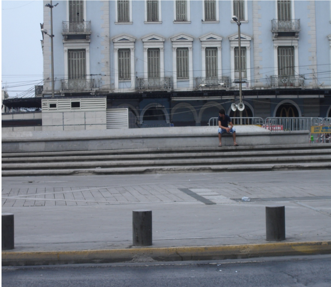
Εικ. 2 Πλατεία Ομόνοιας, Ιούλιος 2010. Ύστερα από τις αναπλάσεις, η θύελλα

Με οδυνηρό τρόπο (Εικόνα 2) διδάσκουν ότι πριν καταπιαστεί κανείς με την αξιολόγηση της ποιότητας ενός αρχιτεκτονικού έργου, οφείλει να αξιολογήσει την ουσιώδη χρησιμότητα του έργου αυτού · τη βαθύτερη δυνατότητά του να γονιμοποιηθεί μέσα στο πεδίο υποδοχής του · την προσδοκία να συναφθούν, μεταξύ έργου και πεδίου, λεπτές και πολυσήμαντες, αμφίδρομες σχέσεις.