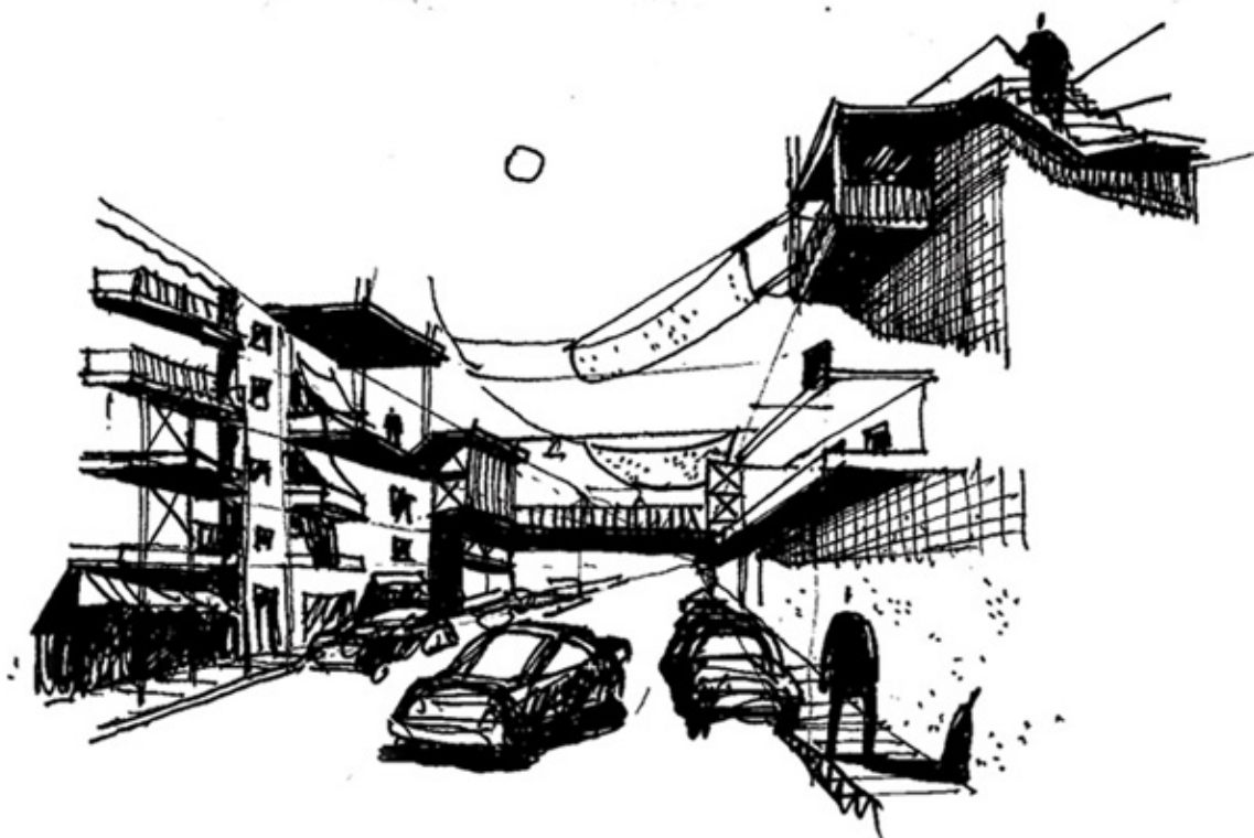
Εικ. 9. Σκίτσο του αρχιτέκτονα Γιάννη Αγγελάκου, από τη διπλωματική του εργασία «Αναμόρφωση κεντρικής περιοχής στον Πειραιά – Ένα σύστημα αναζωογόνησης της πόλης», Τμήμα Αρχιτεκτόνων Μηχανικών ΔΠΘ, 2009

Να, αυτό είναι ένα μερικό, στιγμιαίο κοίταγμα στον άγριο, εγκαταλελειμμένο «αγρό» του δημόσιου πεδίου που όμως, σε πείσμα των αφόρητων μειονεκτημάτων του, επιμένει να γεννοβολά σπόρους –απρόβλεπτες, λανθάνουσες δυναμικές- αρχιτεκτονικών αξιών, όπως η εξ ανάγκης εξωστρέφεια, η εξ ανάγκης παραβατική επινοητικότητα, η εξ ανάγκης βίωση της κινητικότητας και της διαδρομής, η εξ ανάγκης εξοικείωση με σύνθετες, στριφνές χωρικές διατάξεις, η εξ ανάγκης αντίσταση στη φθορά. Και, το κυριώτερο: ένα, εξ ανάγκης, διαρκές υποδόριο κάλεσμα/κίνητρο για σκέψεις και προτάσεις υπέρβασης αυτών καθαυτών των αφόρητων μειονεκτημάτων του, προτάσεις όμως συνθετικά συγκροτημένες, δηλαδή τέτοιες που να πάλλονται σε οργανική συνέργεια με την πραγματική υπόσταση που εδρεύει στις ρίζες του προς επίλυση προβλήματος (εικόνα 9) και όχι με κάποιο υποκατάστατό του που εκπορεύεται από τις ύποπτες φαντασιώσεις και τα σύνδρομα των αξιολογικών διευθυντηρίων. (Παράδειγμα τέτοιου υποκατάστατου: Βαρκελώνη 2000 + Αθήνα 2004 → Αθήνα=Βαρκελώνη).