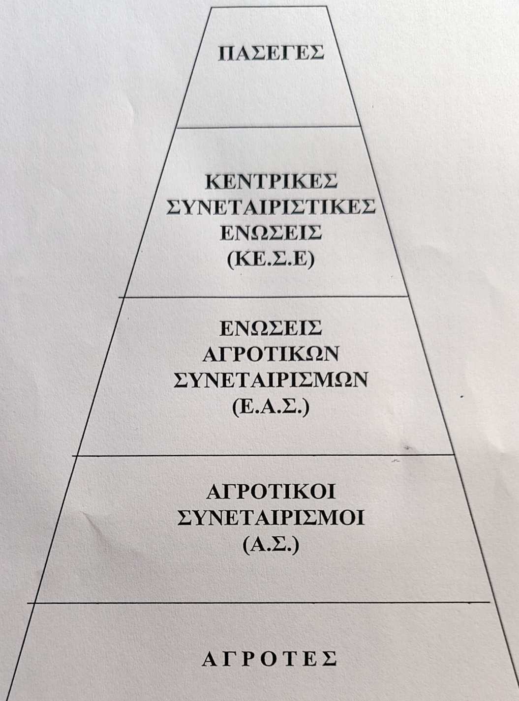
Σχήμα 6.2. Δομή των αγροτικών συνεταιριστικών οργανώσεων