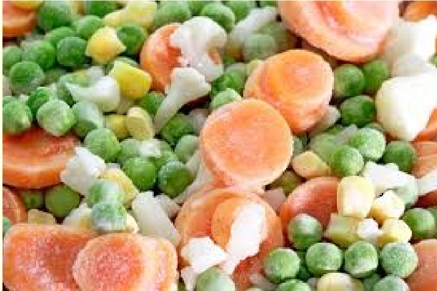
Individual Quick Freezing (IQF)