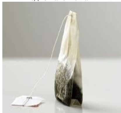
едно пакетче чай