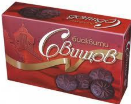
една кутия бисквити