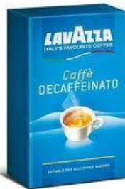
една кутия кафе