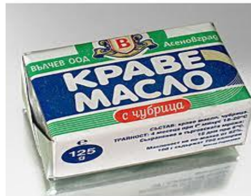
едно пакетче масло