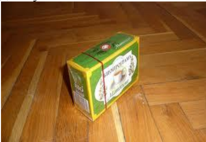
една кутия чай