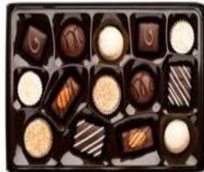
една кутия бонбони