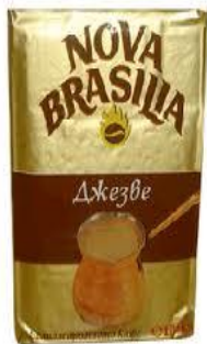
едно пакетче кафе