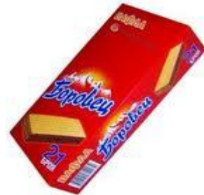
една кутия вафли