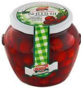
един буркан компот от вишни