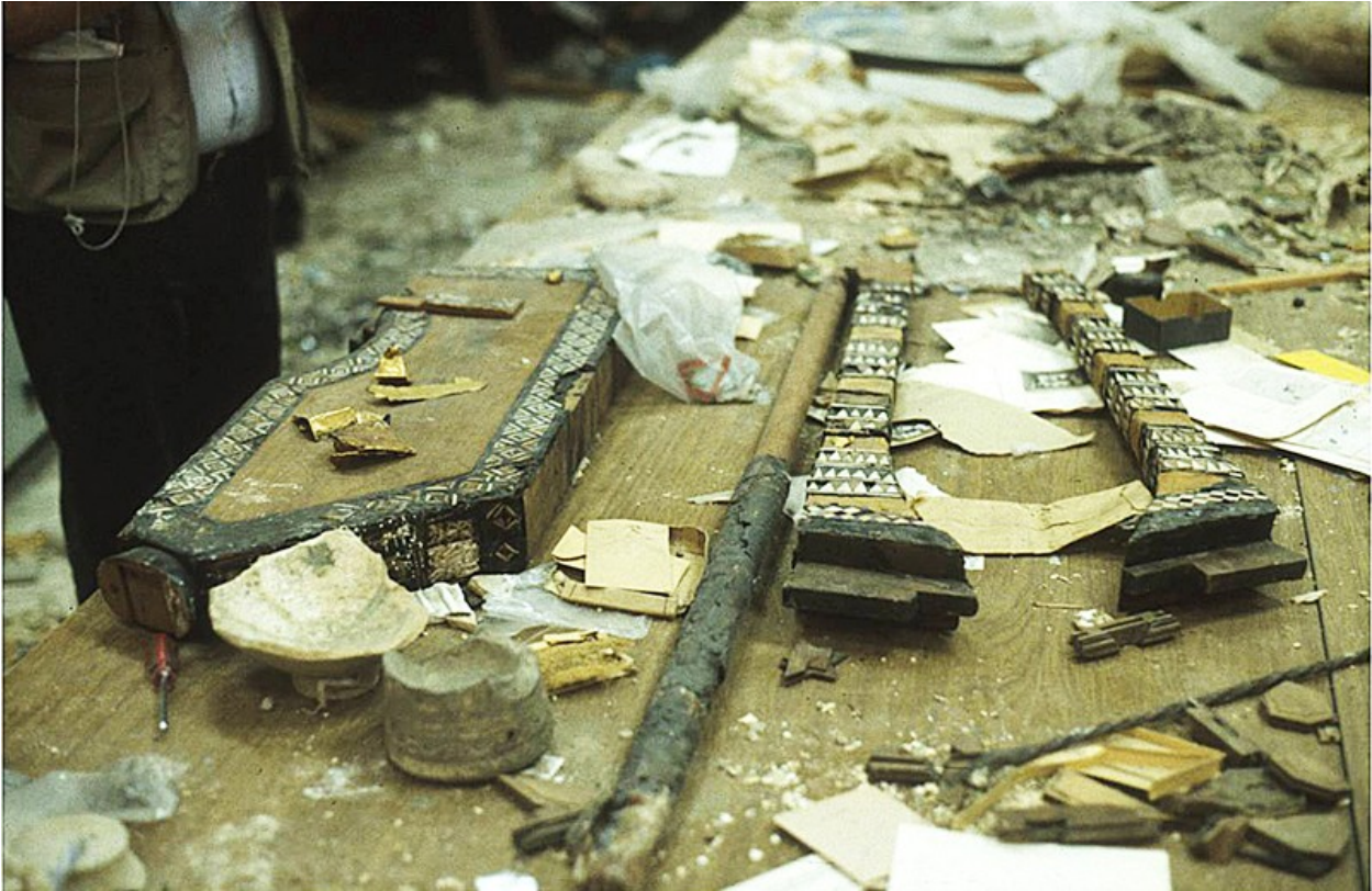
Εικόνα 11: Η κατεστραμμένη χρυσή λύρα της πόλης Ουρ, 2.600 ετών