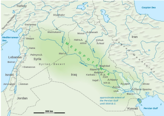
Εικόνα 5: Μεσοποταμία

Η περιοχή ανάμεσα στους Ποταμούς Τίγρη και Ευφράτη, γνωστή ως Μεσοποταμία, θεωρείται μια από τις κοιτίδες της ανθρώπινης δραστηριότητας, του ανθρώπινου πολιτισμού. Εκεί προέκυψαν επιτεύγματα όπως η γραφή (σφηνοειδής), το άροτρο, ο τροχός για τις άμαξες, ανακαλύψεις σε μαθηματικά και αστρονομία. Εκεί αναπτύχθηκαν οι πρώτες πόλεις κράτη των Σουμέριων, οι Ασσύριοι και οι Βαβυλώνιοι, και όλοι οι μετέπειτα πολιτισμοί που