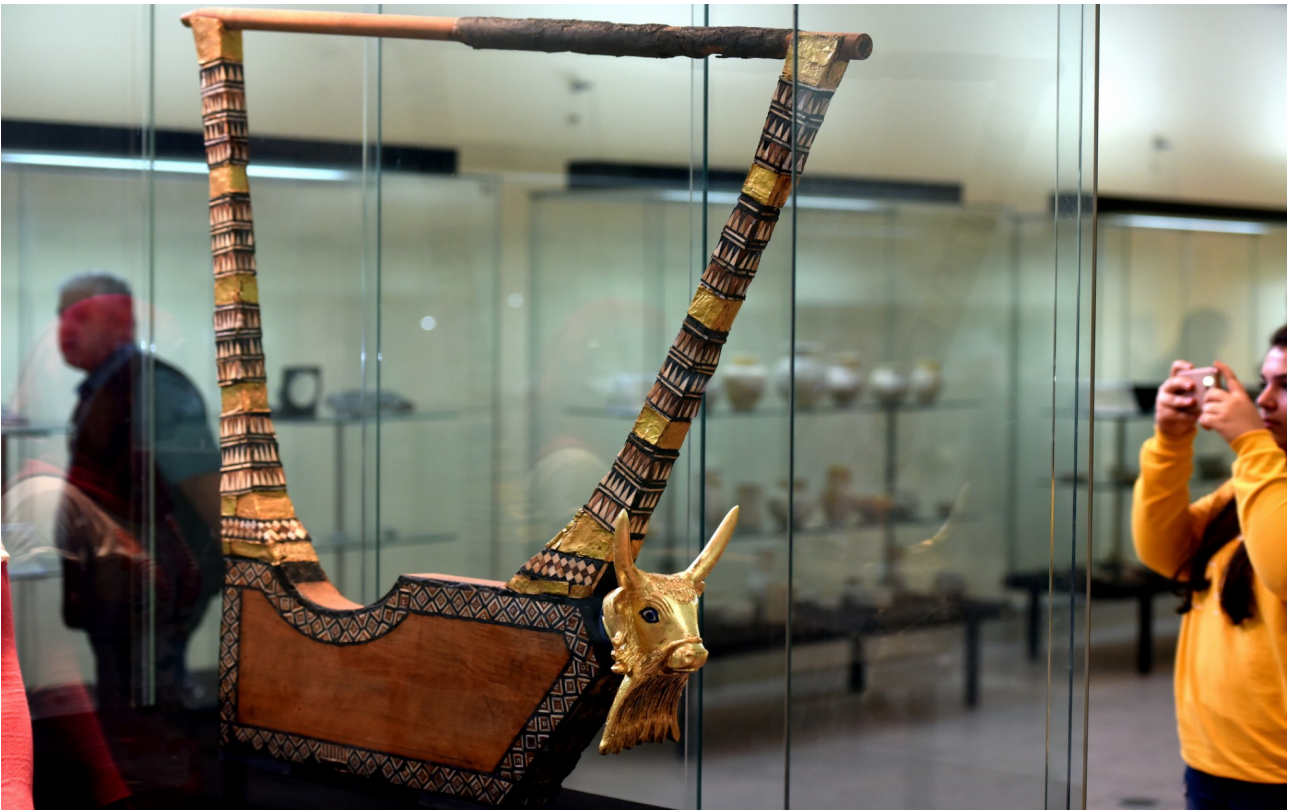
Εικόνα 12: Αναδημιουργία της λύρας, η οποία βρίσκεται σήμερα στο Εθνικό Μουσείο του Ιράκ