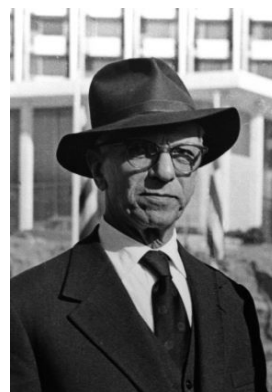
Εικόνα 3: Χρήστος Καρούζος

Ο Χρήστος Καρούζος,γεννηθείς στην Άμφισσα,σπούδασε στη φιλοσοφική σχολή του ΕΚΠΑ φιλολογία και αρχαιολογία. Ήταν ένας πολυσχιδής 7 άνθρωπος με έργο και πέραν της αρχαιολογίας,καθώς συνδέθηκε με τους δημοτικιστές της γλωσσικής μεταρρύθμισης και με τη κριτική της τέχνης. Εισέρχεται στην Αρχαιολογική υπηρεσία το 1919 και το 1925 γίνεται έφορος αρχαιοτήτων. Παντρεύτηκε με τη Σέμνη το 1931 και οι δυο τους ήταν πρωτεργάτες στην απόκρυψη και διάσωση των αρχαιοτήτων του Εθνικού Αρχαιολογικού Μουσείου(ΕΑΜ) κατά τη διάρκεια της τριπλής κατοχής. Το <<έπος της απόκρυψης>> 8 ήταν ένας αγώνας από επιτροπές απόκρυψης και ασφάλισης αρχαιοτήτων σε όλα τα μουσεία,πριν ξεκινήσει ακόμη ο πόλεμος,στο ΕΑΜ συγκεκριμένα χρειάστηκαν 6 μήνες.