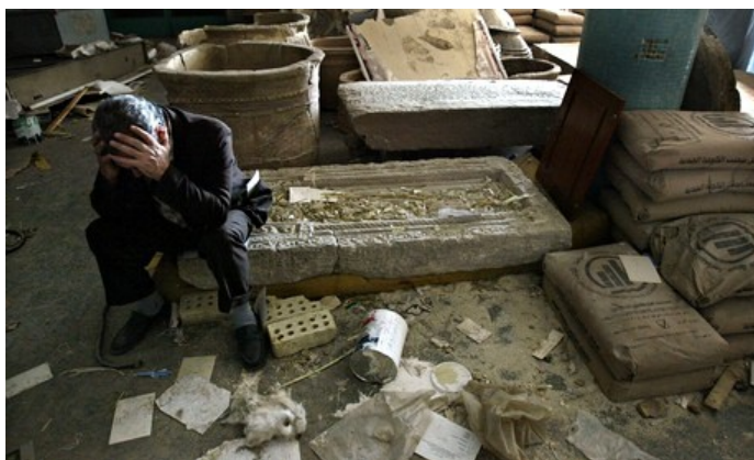
Εικόνα 10: Ο υποδιευθυντής του Εθνικού Μουσείου του Ιράκ,13 Απριλίου 2003, και κατεστραμμένα εκθέματα μετά τη πολυήμερη λεηλασία

το εξωτερικό περίπου το 1/3 των κλεμμένων.