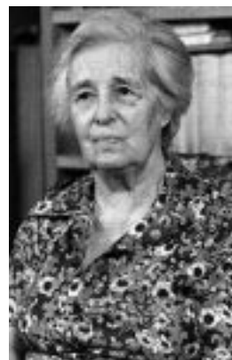
Εικόνα 2 : Σέμνη Καρούζου

Η Σέμνη Παπασπυρίδη-Καρούζου ,γεννηθείσα στη Τρίπολη,έχει χαρακτηριστεί από τον Μανώλη Ανδρόνικο ως η μεγαλύτερη Ελληνίδα αρχαιολόγος 4 .Σπούδασε στο Εθνικό και Καποδιστριακό Πανεπιστήμιο Αθηνών(ΕΚΠΑ).Είναι η πρώτη γυναίκα αρχαιολόγος που διορίζεται στην Αρχαιολογική υπηρεσία το 1921 5 και η πρώτη έφορος(1933-1964) του Εθνικού Αρχαιολογικού Μουσείου. Έπειτα με υποτροφία πραγματοποίησε Μεταπτυχιακές σπουδές στο Μόναχο της Γερμανίας(1928-1930).Είχε επαφές με σημαντικούς πνευματικούς ανθρώπους 6 της εποχής όπως Νίκος Καζαντζάκης,Άγγελος Σικελιανός,Μανώλης Τριανταφυλλίδης.