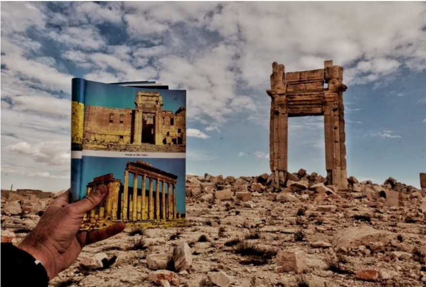
Εικόνα 7: Ο ναός του Μεσοποτάμιου Θεού Μπελ, πριν και μετά τη καταστροφή