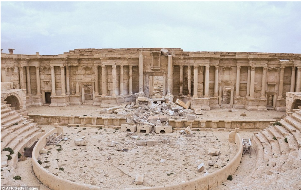
Εικόνα 8: Ο αρχαίος Ρωμαϊκός ναός της Παλμύρας μετά την ήττα του ISIS. Εμφανείς οι ζημιές.