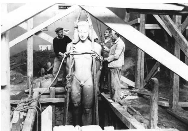
Εικόνα 4 : Απόκρυψη του Κούρου του Σουνίου

Το ζεύγος Καρούζου ήταν οι μόνοι που αποχώρησαν από το Γερμανικό Αρχαιολογικό Ινστιτούτο 13 κατά τη κατοχή και επέστρεψαν τις τιμητικές διακρίσεις που είχαν από τη Γερμανία.