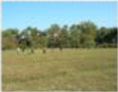
Έργον κατασκευής του Ιερού του Μίθρα Καλού Οχρωπού.

http://igoumenitsamuseum.gr/images/text_files/to-imerologio-enos-arxaiologou-ekpaideutikos.pdf