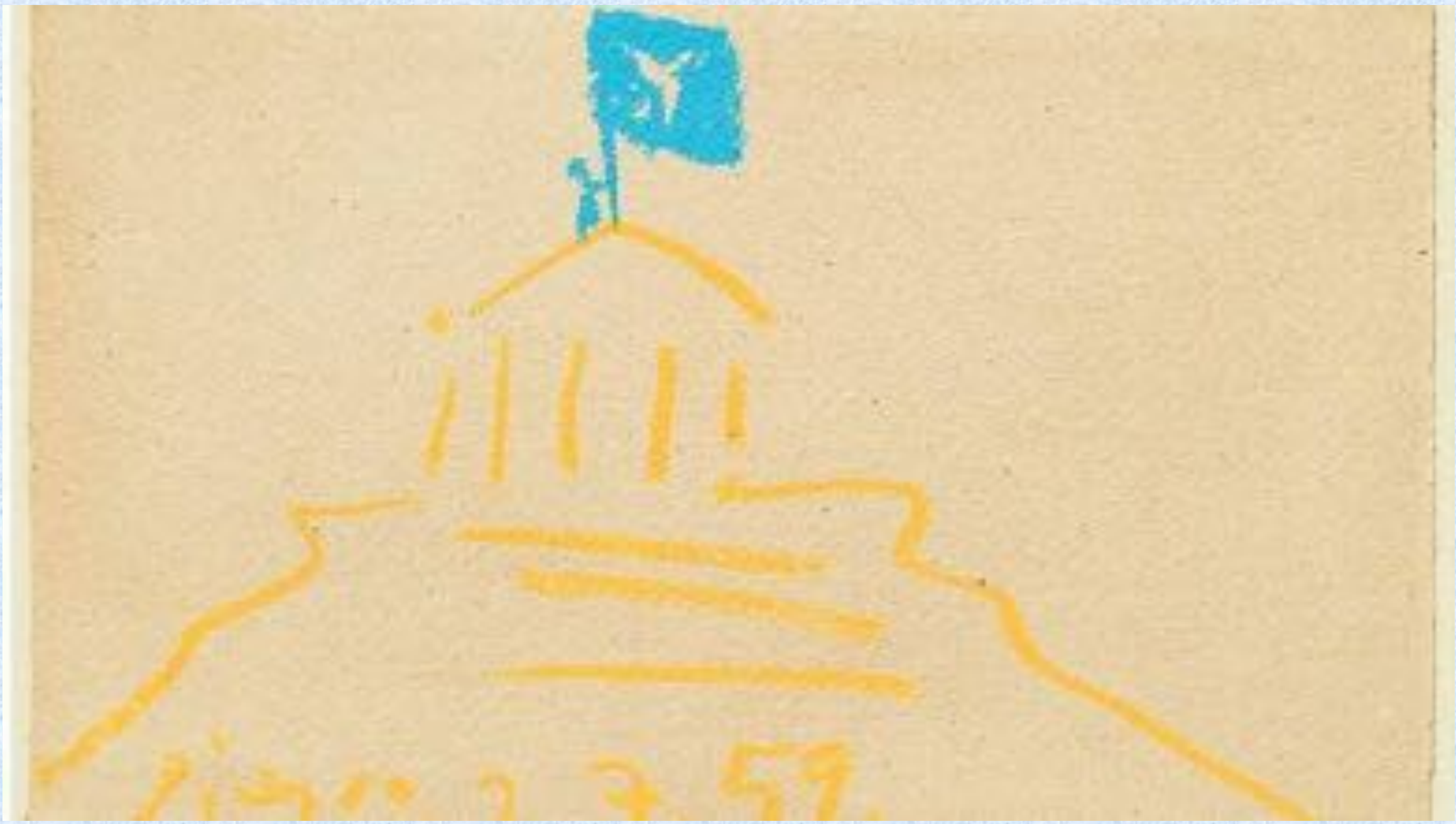
Figure 2 3 59