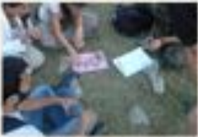
Επισκεψή μουσειολογής στα ερείπια της αρχαίας πόλης.