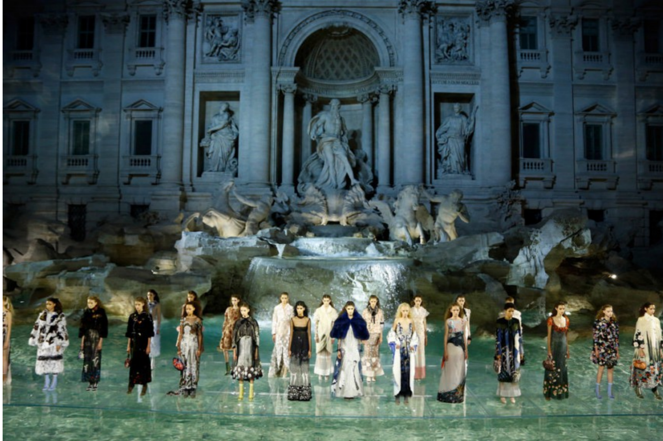
Η επίδειξη του οίκου Fendi στη Φοντάνα ντι Τρέβι.