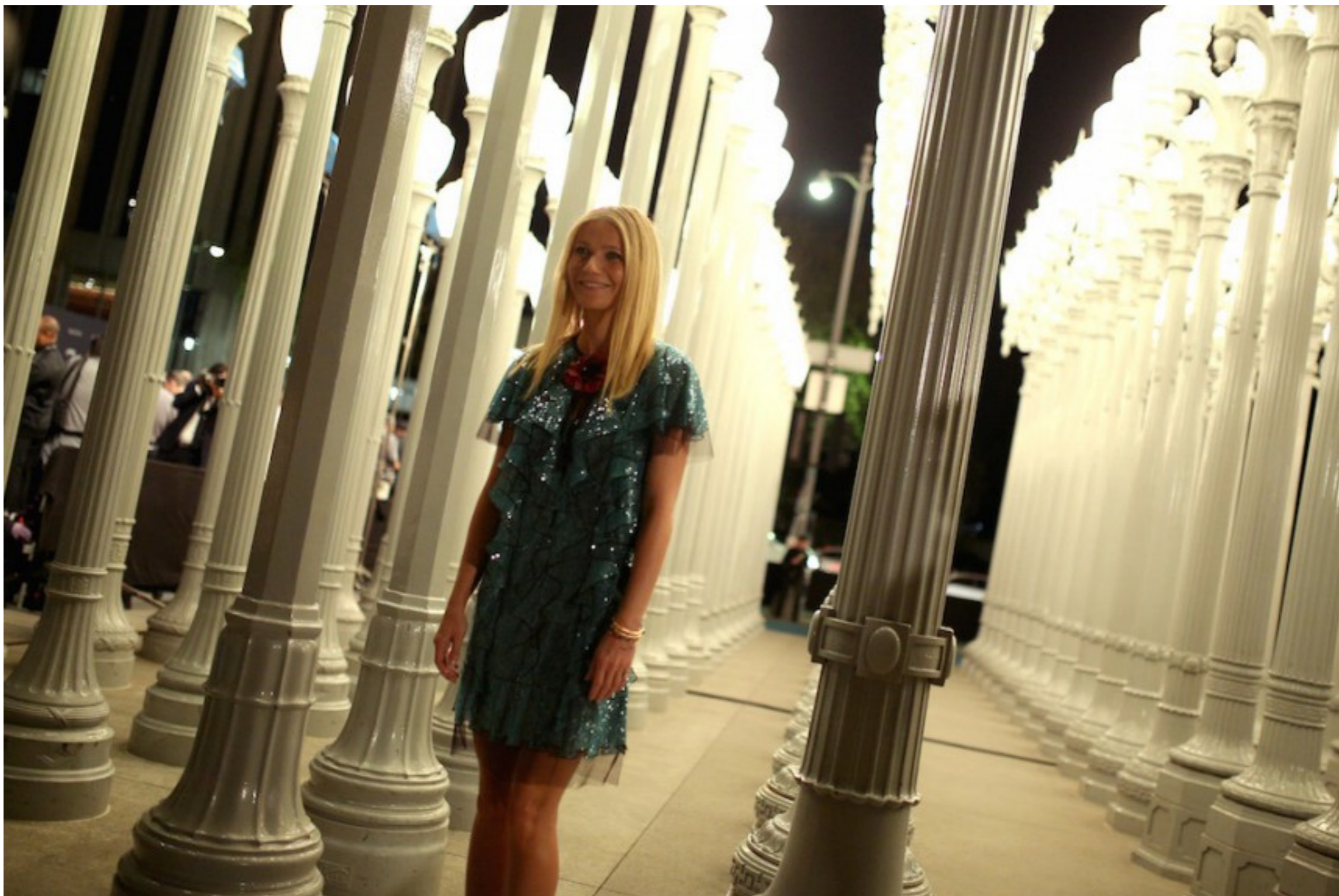
Η Gwyneth Paltrow στην εκδήλωση του οίκου Gucci στο LACMA στο Λος Άντζελες.

δημοσιογράφοι που παρακολούθησαν τη συνεδρίαση του ΚΑΣ είχαν καταγράψει όλα τα στοιχεία): «Επιβεβαιώνουμε ότι πραγματοποιήθηκε συνάντηση με τις ελληνικές Αρχές για να διερευνηθεί η δυνατότητα μιας μακροπρόθεσμης πολιτιστικής συνεργασίας. Αυτό το είδος της πρωτοβουλίας δεν είναι νέο για μας. Τα τελευταία χρόνια η Gucci έχει καθιερώσει τέτοιες πολιτιστικές συνεργασίες με το Palazzo Strozzi στη Φλωρεντία, το Μουσείο Mingshen στη Σανγκάη, το Chatsworth House στην Αγγλία και το LACMA στο Λος Άντζελες. Οι εικασίες σχετικά με την υποτιθέμενη οικονομική πρόταση, άμεση ή έμμεση, είναι απολύτως λανθασμένες και δεν έχουν καμία επιβεβαίωση από εμάς».