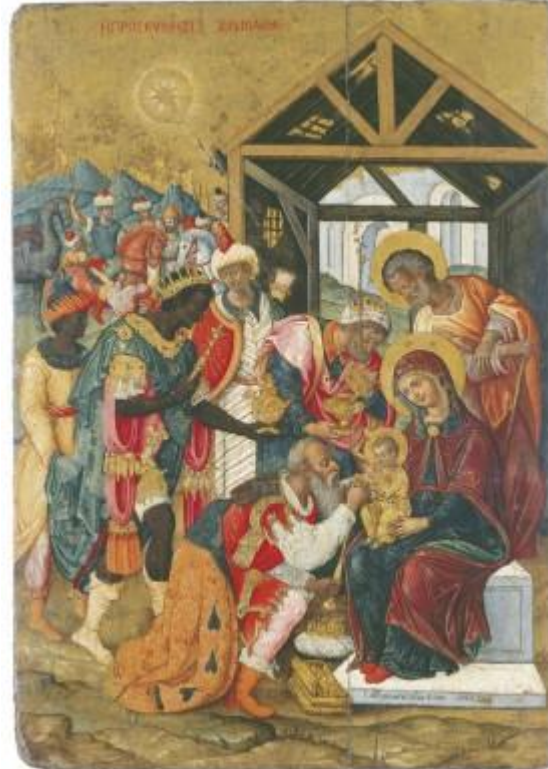
( http://www.byzantinemuseum.gr/el/collections/Loverdos_collection/ )

( 1-4) LIMC ( Lexicon Iconographicum Mythologiae Classicae , Zurich & Munich, 1981-). 1, 2 4 ( ), 3 LIMC. 5-6 , 1- 4 , 1 LIMC, 2 LIMC, 1 ( . LIMC, . 1, . 328): ( . 530 . ). ( . LIMC, . 2, . 451-2, . 294*) 2 ( . LIMC, . 1, . 381): ( . 460 . ). ( . LIMC, . 2, . 481-2, . 705*).