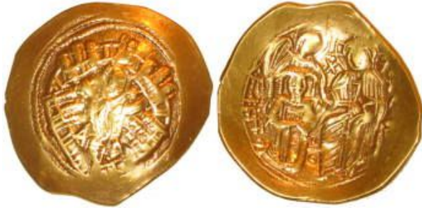
Χρυσό υπέρπυρον Μιχαήλ Η΄ Παλαιολόγου (1261-1282), Κωνσταντινούπολη