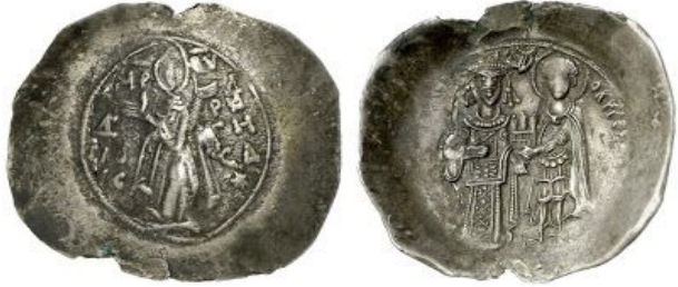
Αργυρό τραχύ Θεόδωρου Κομνηνού Δούκα (1215-1230), Ήπειρος