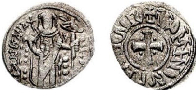
Από κράμα τουρνέσιον Ανδρόνικου Β΄ Παλαιολόγου (1282-1328), Κωνσταντινούπολη