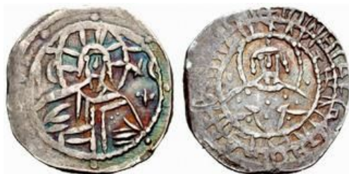
Αργυρό μισό σταυράτον Ιωάννη Η΄ Παλαιολόγου (1425-1448), Κωνσταντινούπολη