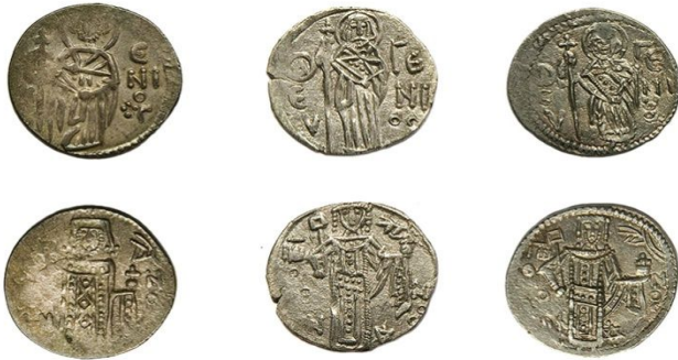
Αργυρά άσπρα Μεγαλοκομνηνών (1204-1461), Τραπεζούντα