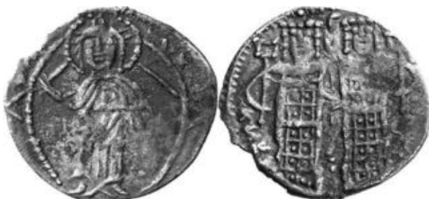
Αργυρό βασιλικόν Ιωάννη Στ' Καντακουζηνού-Ιωάννη Ε' Παλαιολόγου (1347-1353), Διδυμότειχο (1351, Ησυχασμός)