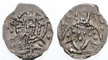
Αργυρό 1/8 του σταυράτου Κωνσταντίνου ΙΑ΄ Παλαιολόγου (1448-1453), Κωνσταντινούπολη