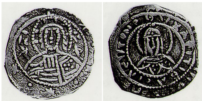
Αργυρό σταυράτον Ιωάννη Ε΄ Παλαιολόγου (1379-1391), Κωνσταντινούπολη