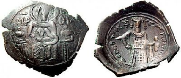
Αργυρό τραχύ Ιωάννη Κομνηνού Δούκα (1237-1242), Θεσσαλονίκη