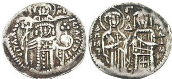
Αργυρό βασιλικόν Άνας Παλαιολογίνας-Ιωάννη Ε' Παλαιολόγου (1341-1347), Κωνσταντινούπολη (1341, στέψη Ιωάννη Ε' Παλαιολόγου)