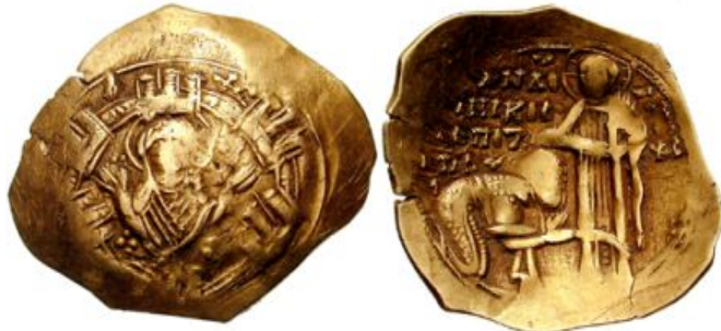
Χρυσό υπέρπυρον Ανδρόνικου Β΄ Παλαιολόγου (1282-1294), Κωνσταντινούπολη