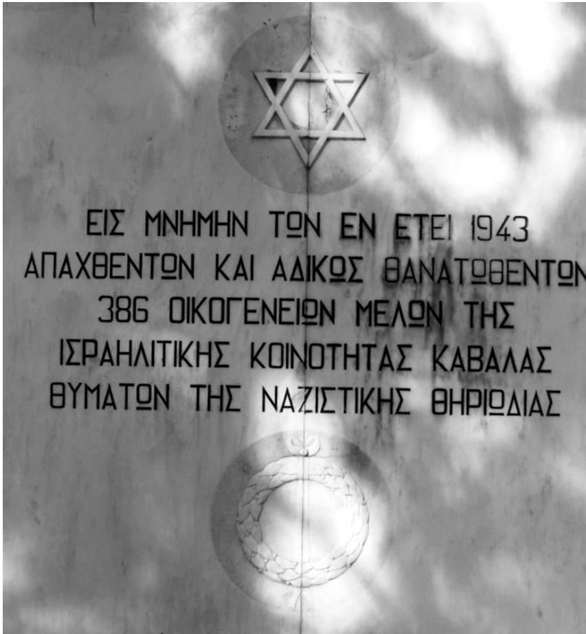
Εικ. 6: Η επιγραφή στο μνημείο του εβραϊκού νεκροταφείου (1955)

Από το 1990-91 ο Σαμπετάι Τσιμίνο, ως ο μοναδικός Εβραίος κάτοικος της Καβάλας και Πρόεδρος της Ισραηλιτικής Κοινότητας, συντονίζει εκτεταμένες εργασίες στο δεύτερο εβραϊκό νεκροταφείο, το οποίο άρχισε να λειτουργεί το 1902 και είναι προσαρτημένο στο σημερινό χριστιανικό νεκροταφείο, στις ανατολικές παρυφές της πόλης. Το βρίσκεται σε κακή κατάσταση, επιχωματωμένο και με τις πλάκες πολλών τάφων σπασμένες (από άγνωστη αιτία). Αξιοποιώντας πόρους της Εβραϊκής Κοινότητας αναδιευθετεί τον χώρο (συνολικής έκτασης 5.750 τ.μ.), αποκαθιστά τους περίπου 735 τάφους και προσθέτει σε πολλούς από αυτούς το άστρο του Δαυίδ. Μετά από πολυετείς και πολυδάπανες προσπά-