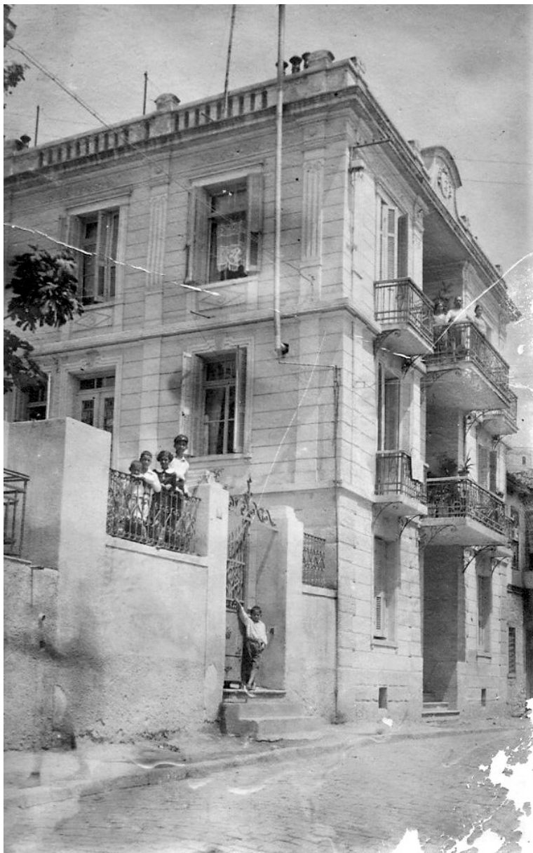
Εικ. 2: Το τριώροφο νεοκλασικό της οικογένειας Ααρών Τσιμίνο στην Καβάλα (δεκαετία 1930)