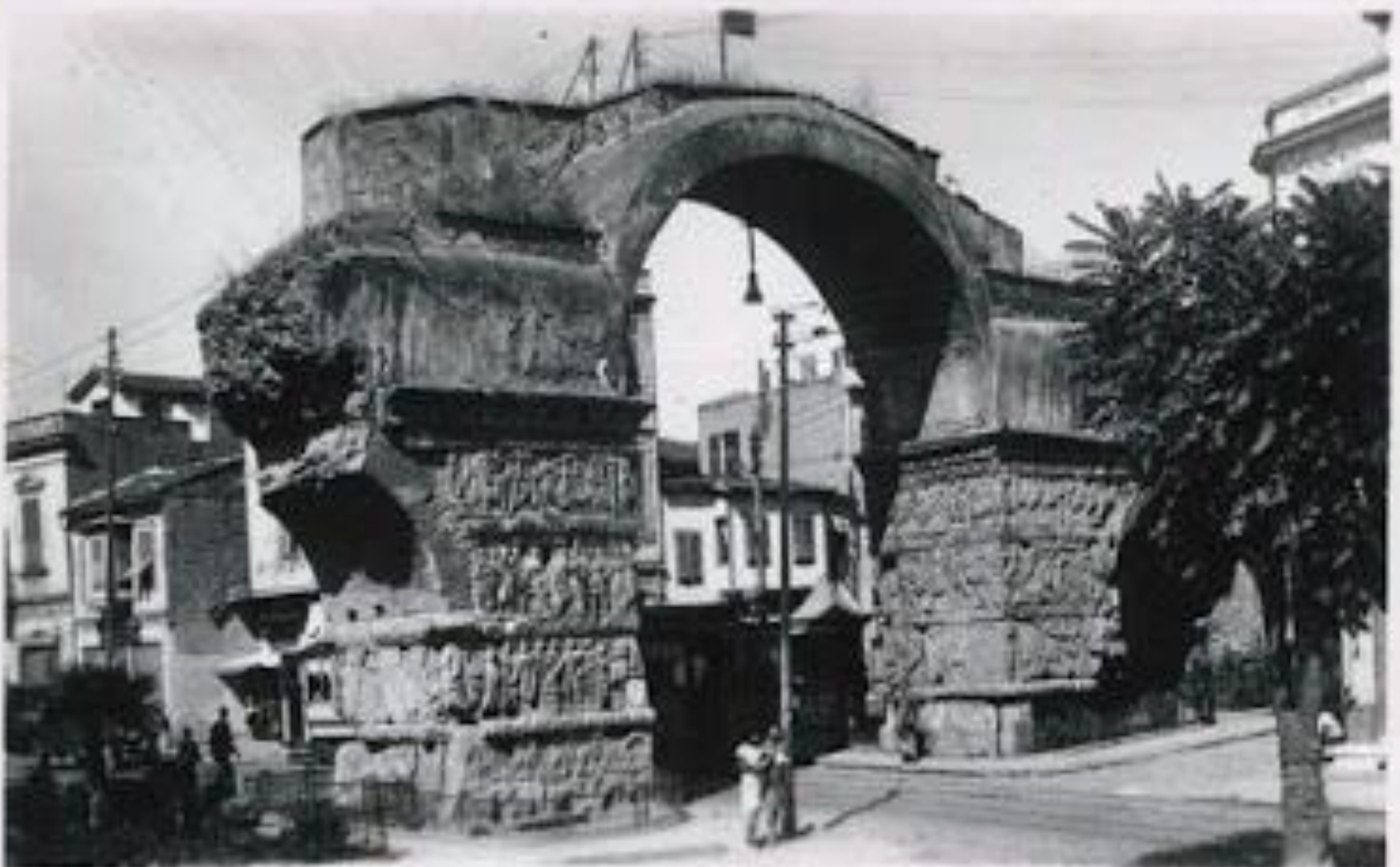
1414-58. ΘΕΣΣΑΛΟΝΙΚΗ. Θριαμβευτική όψις Γαλερίου THESSALONIKI. Arc de triomphe de Galerius