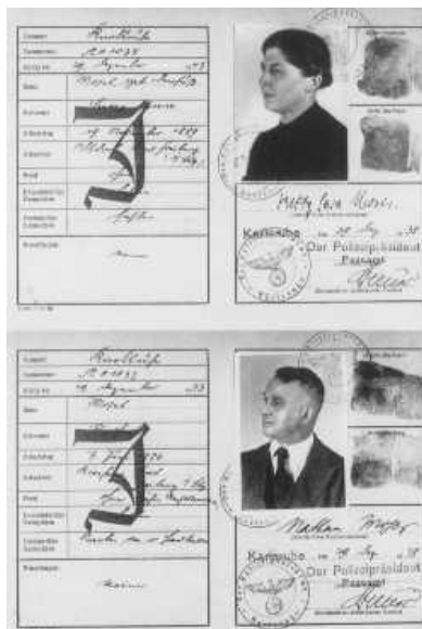
Εικόνα 1 Ταυτότητα ζεύγους Εβραίων. Το J σημαίνει "Jude" (=Εβραίος)

Για περισσότερα βλ. https://encyclopedia.ushmm.org/content/el/article/the-nuremberg-race-laws