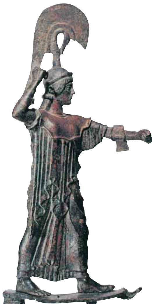
Η Αθηνά Πρόμαχος (χάλκινο αναθηματικό αγαλμάτιο, 480-470 π.Χ., Εθνικό Αρχαιολογικό Μουσείο Αθήνας)