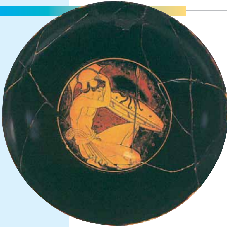
Αττική ερυθρόμορφη κύλικα με παράσταση οπλίτη στον πυθμένα (505-500 π.Χ., Εθνικό Αρχαιολογικό Μουσείο Αθήνας)