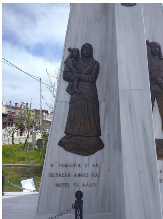
Εικ. 2 Μορφή μάνας και παιδιού στον χώρο του Μνημείου Γενοκτονίας των Ποντίων (Φωτογραφικό αρχείο Μ. Βεργέτη, Α. Καραγιάννη, 2020)

Στάδιο 3 ο : Η αφήγηση ιστοριών ζωής έχει αρχικά τη μορφή μονολόγου, ενώ στη συνέχεια εμπλουτίζεται με την αλληλεπίδραση των μελών της ομάδας καθώς ο μονόλογος εξελίσσεται σε διάλογο με την κατάλληλη εμπύχωση από παιδαγωγούς. Προκύπτουν ερωτοαπαντήσεις προς ανάκληση της μνήμης με αφορμή τις ιστορίες ζωής των Ποντίων (αξιοποίηση θεατρικής τεχνικής Θέατρο Φόρουμ ).