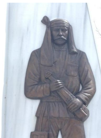
Εικ. 1 Μορφή άντρα στον χώρο του Μνημείου Γενοκτονίας των Ποντίων

Στάδιο 1 ο : Η έναρξη εργαστηρίου γίνεται με τη μελωδία ενός ποντιακού τραγουδιού ή χορού (με την παρουσία χορευτών από ποντιακό σύλλογο). Με αυτόν τον τρόπο, η ακινησία της ανάγλυφης παράστασης του Πόντιου που κρατά τη λύρα (εικ. 1), μετατρέπεται σε δυναμική στάση σώματος, η ακινησία εξελίσσεται σε κίνηση ως μουσικό δρώμενο.