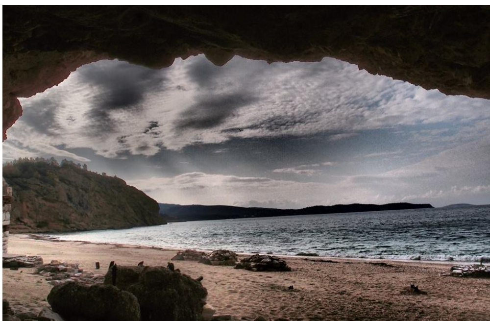
Άποψη της παραλίας μέσα από τη σπηλιά