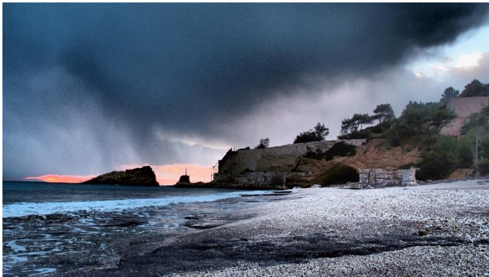
Σκάλα εκφόρτωσης- Σπηλιά- παραθαλάσσιο κτίσμα

Η διαμόρφωση της σκάλας είναι από λιθοδομή καλά δομημένη. Διασώζεται ξύλινο ικρίωμα με μεταλλικό ρύγχος και κρηπίδωμα από σκυρόδεμα. Η σκάλα φόρτωσης μεταπολεμικά μετακατασκευάστηκε, χρησιμοποιώντας τα υλικά της προηγούμενης. Κοντά ε αυτή υπήρχαν αρκετά μικρά κτίσματα, τα οποία πιθανότατα λειτουργούσαν για έλεγχο και καταγραφή του υλικού που εξαγόταν. Εντυπωσιακή είναι η σπηλιά στο επίπεδο της παραλίας, πίσω από τη σκάλα εκφόρτωσης, η οποία οδηγεί σε τούνελ με άνοιγα μικρών διαστάσεων- από το οποίο πιθανόν περνούσαν βαγόνια, καθώς διακρίνονται σιδηροδρομικές γραμμές- που συνδέει τη παραλία μπροστά από τα μεταλλεία με τη διπλανή της στα δυτικά.