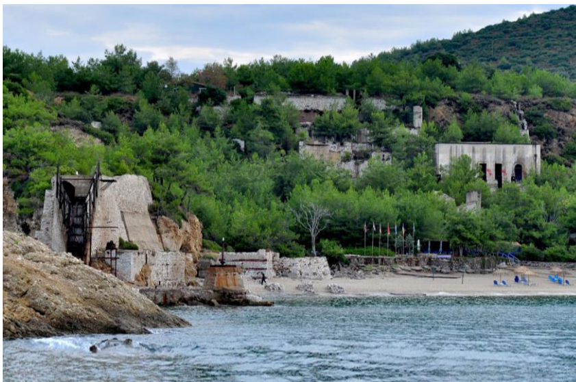
Σκάλα εκφόρτωσης από τη θάλασσα- νότια όψη