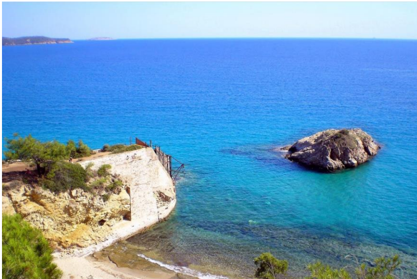
Άποψη δυτικής μεριάς σκάλας εκφόρτωσης