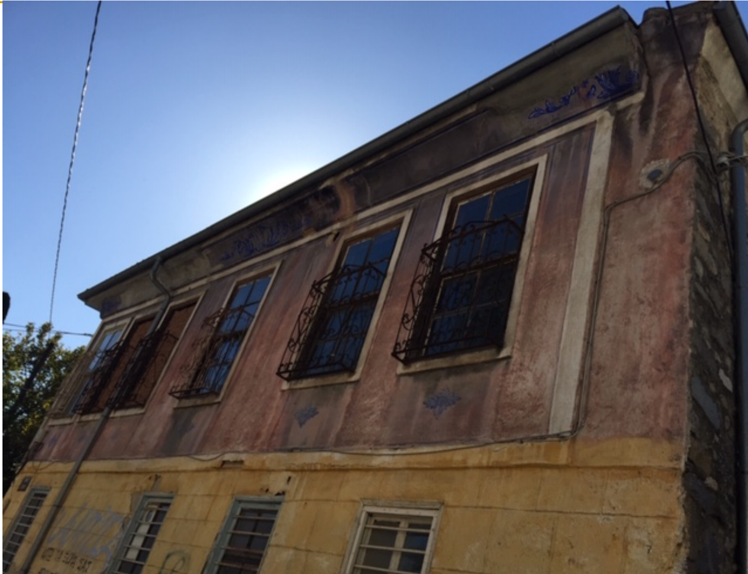
Παράδειγμα λαϊκής οικίας με διάκοσμο στην όψη