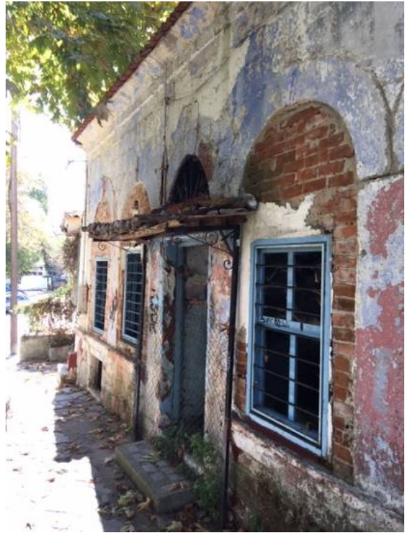
Παραδείγματα αλλοιώσεων στις όψεις των κτιρίων