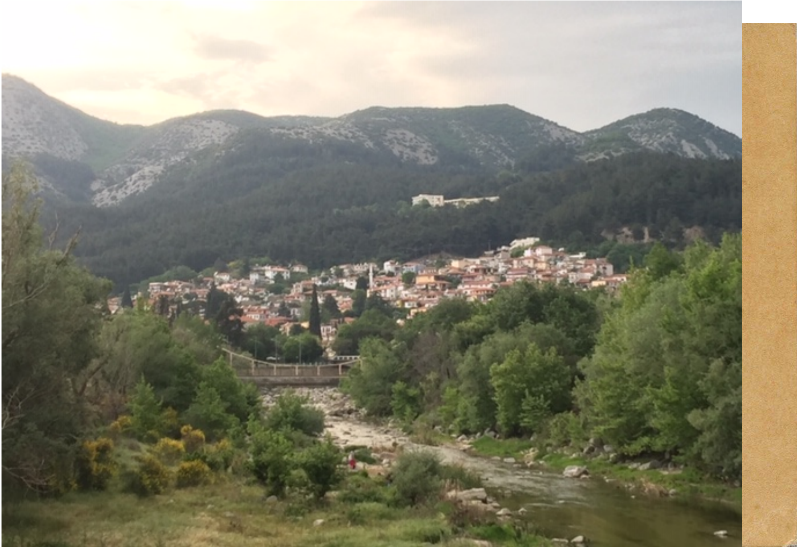
Άποψη της παλιάς πόλης από τον ποταμό Κόσυνθο