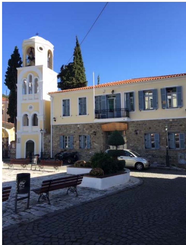
Άποψη της κεντρικής πλατείας (Πλατείας Μητροπόλεως)