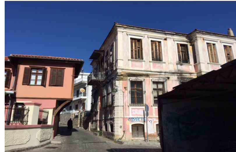
Παραδείγματα διαμόρφωσης οδικού δικτύου-απουσίας οπτικών φυγών στον πολεοδομικό ιστό της Παλιάς Πόλης