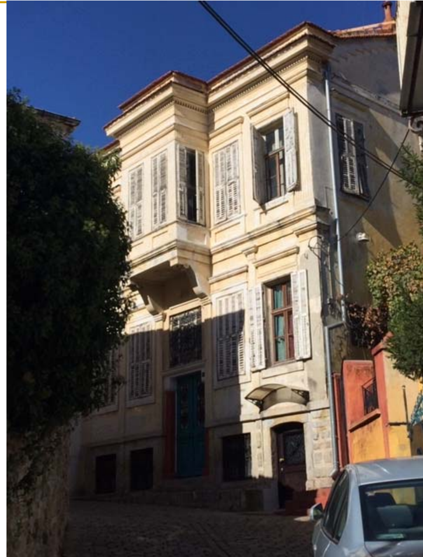
Οικία νεοκλασσικού ύφους με έντονη συμμετρία στην όψη, έρκερ και άφθονα διακοσμητικά στοιχεία νεοκλασσικού λεξιλογίου