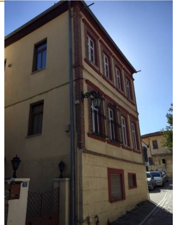
Οικίες λαϊκής αρχιτεκτονικής με λόγια στοιχεία