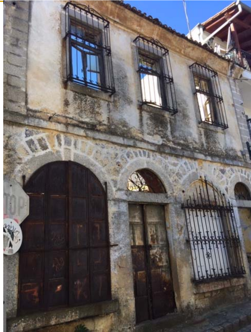
Χρήση τούβλου-λίθου περιμετρικά των ανοιγμάτων ως διακοσμητικού στοιχείου