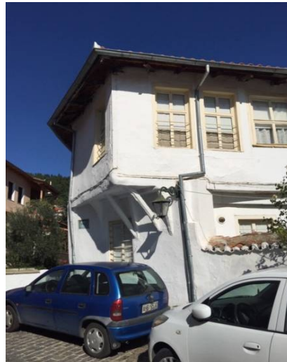
Τύποι σαχισιών σε παραδοσιακές οικίες