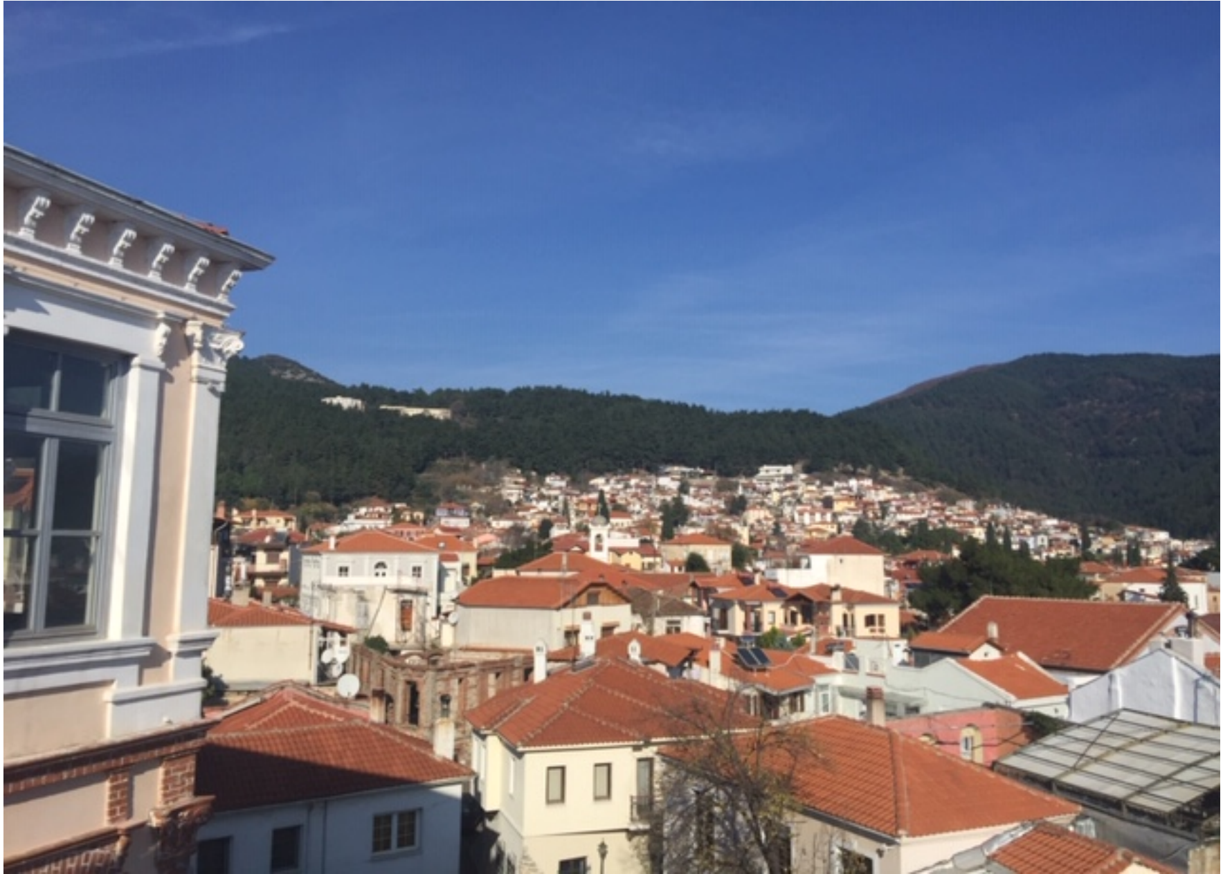
Άποψη της πόλης από την οικία Δανιήλ (Παλαιό Φρουραρχείο)