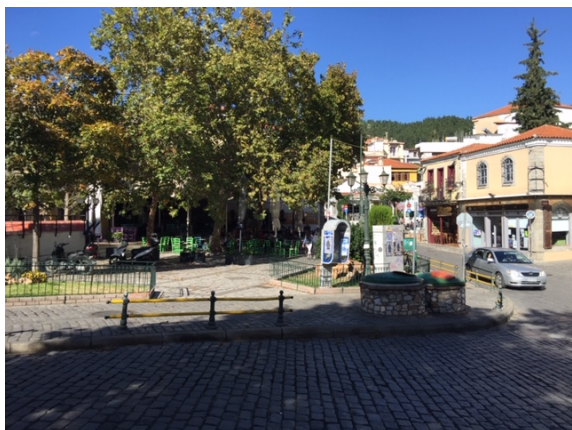
Η πλατεία Αντίκα στο νότιο τμήμα της Παλιάς Πόλης