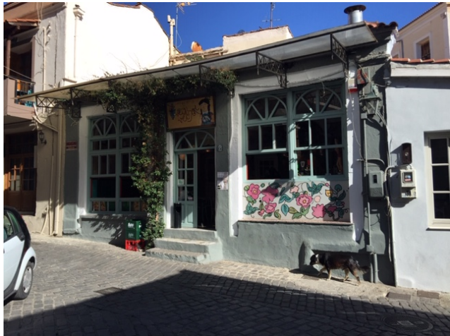
Διάφοροι τύποι καταστημάτων