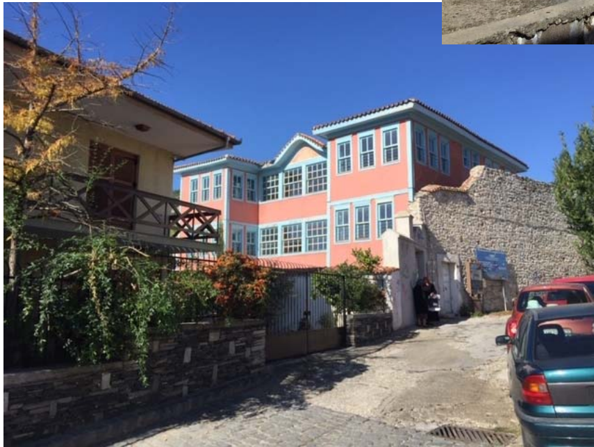
Αρχοντικό Μουζαφέρ Μπέη (σήμερα ιδιοκτησία Δήμου Ξάνθης)