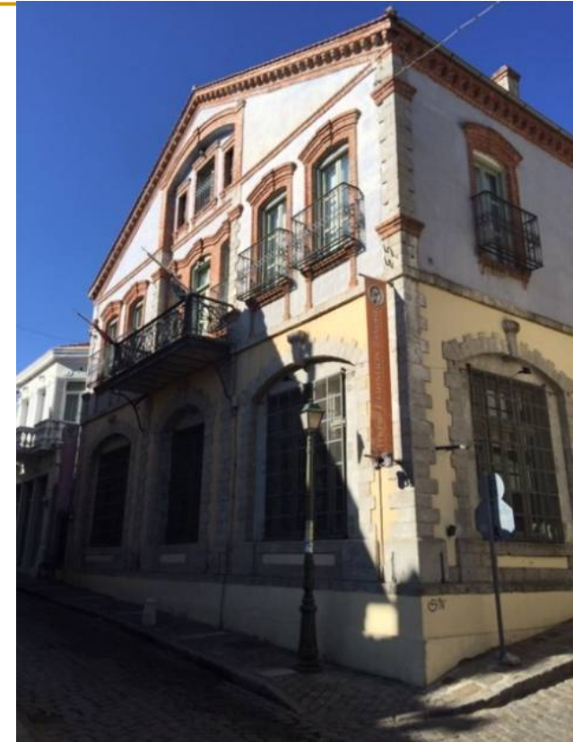
Αρχοντικό Χασιριτζόγλου (σήμερα Λύκειο Ελληνίδων)