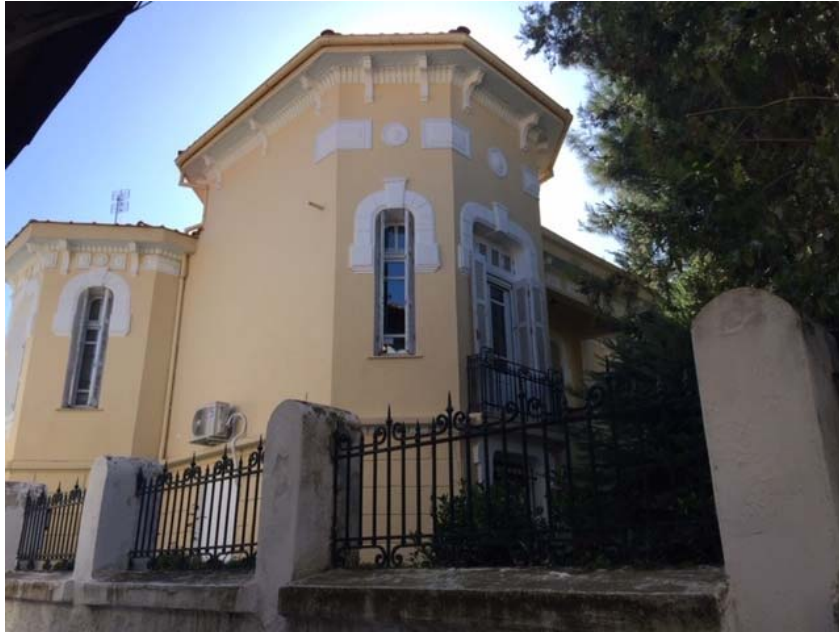
Αρχοντικό Καραδήμογλου (με στοιχεία art-deco)