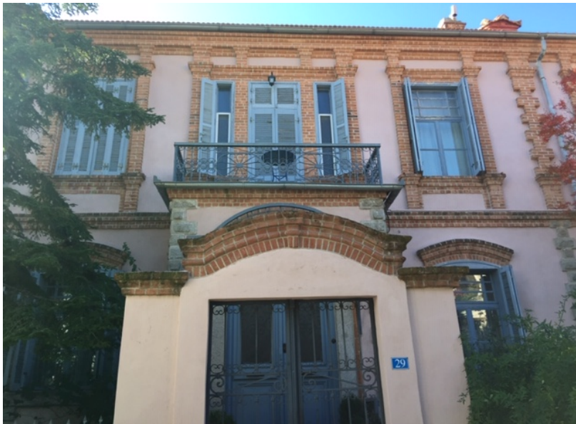
Μία εκ των τεσσάρων “εν σειρά” οικιών Μιχάλογλου