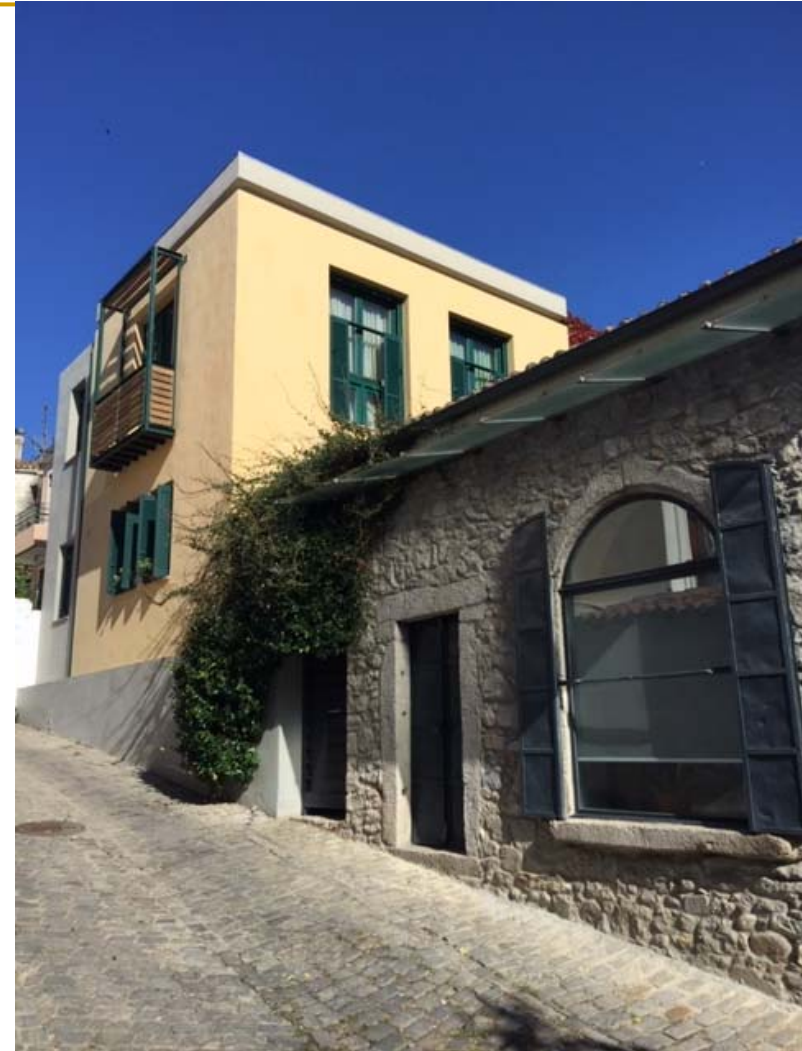
Παραδείγματα σύγχρονων κατασκευών μέσα στον παραδοσιακό ιστό