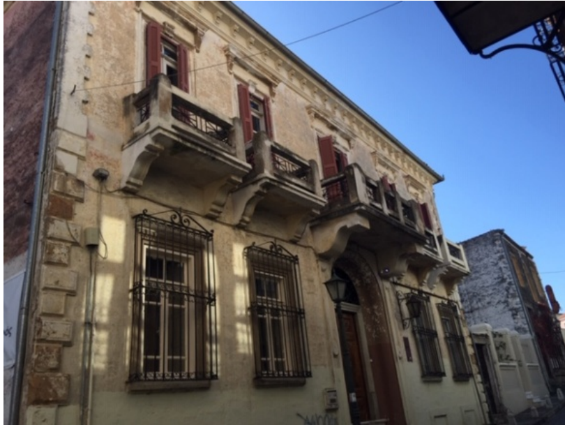
Οικία Στάλιου (σήμερα στεγάζει τον Ερυθρό Σταυρό)