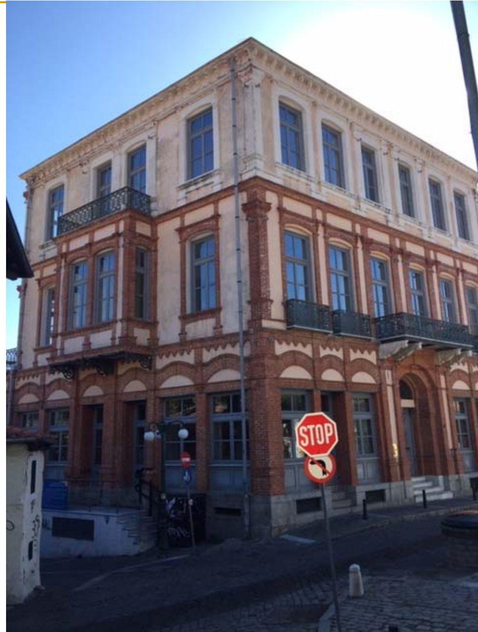
Οικία Ισαάκ Δανιήλ-Παλιό Φρουραρχείο Νυν “Χατζηδάκειο”