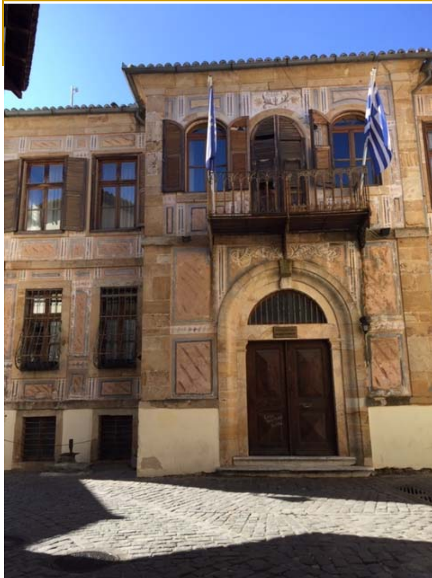
Αρχοντικό Καλούδη (Οικία Κουγιουμτζόγλου)