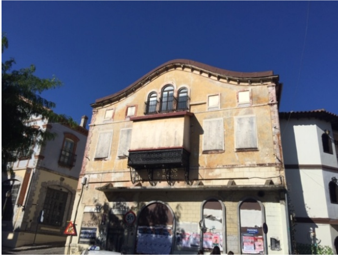
Οικία Στάλιου (ιδιοκτησία του ΔΠΘ)