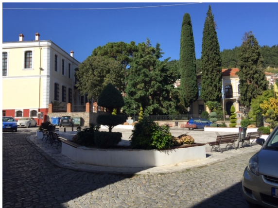
Η πλατεία Μητροπόλεως