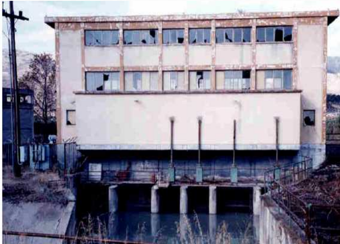
Σχ. 2 Χαρακτηριστική εικόνα που προδίδει μειωμένη φροντίδα και συντήρηση ενός αντλιοστασίου στην περιοχή των εγχειοβελτιωτικών έργων του Κάτω Αχελώου.