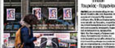
Ένας τορκός - Γερμανός