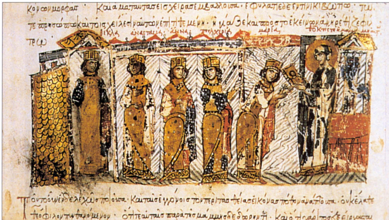
7. Εικονογράφηση από τη «Χρονογραφία» του Σκυλίτζη, MS. Vitr. 26-2, Εθνική Βιβλιοθήκη, Μαδρίτη, φύλ. 44v (τέλη 1Β' αιώνας - αρχές 11' αιώνα): οι πέντε θυγατέρες του Θεόφιλου και της Θεοδώρας, που αναφέρονται με τα ονόματά τους (από αριστερά προς τα δεξιά), Θέκλα, Αναστασία, Άννα, Πολυχέρια και Μαρία, διδάσκονται τη λατρεία των εικόνων από τη γιαγιά τους Θεοκτίστη