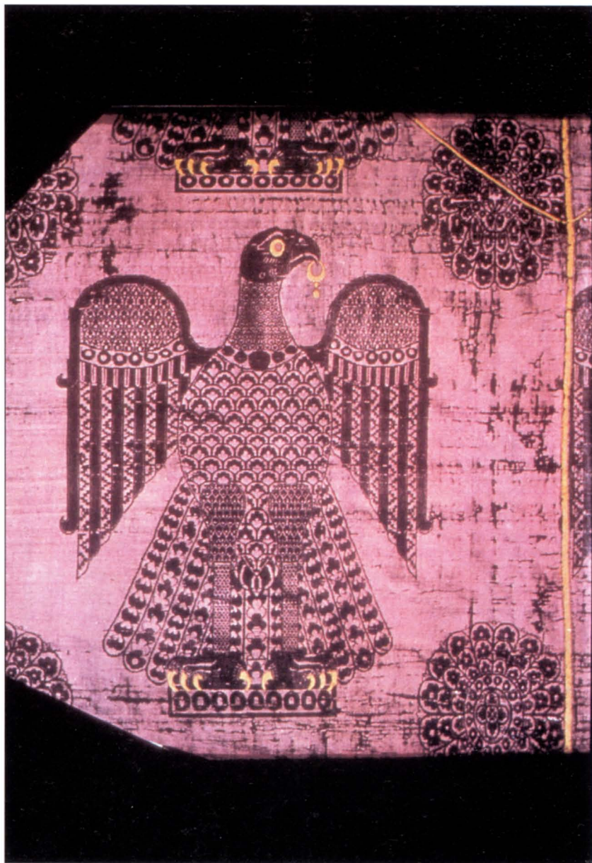
8. Μεταξωτό με ψιγούρα αετού από το Μητροπολιτικό Θησαυροφυλάκιο στο Brixen/Bressanone, Η/Θ' αιώνας