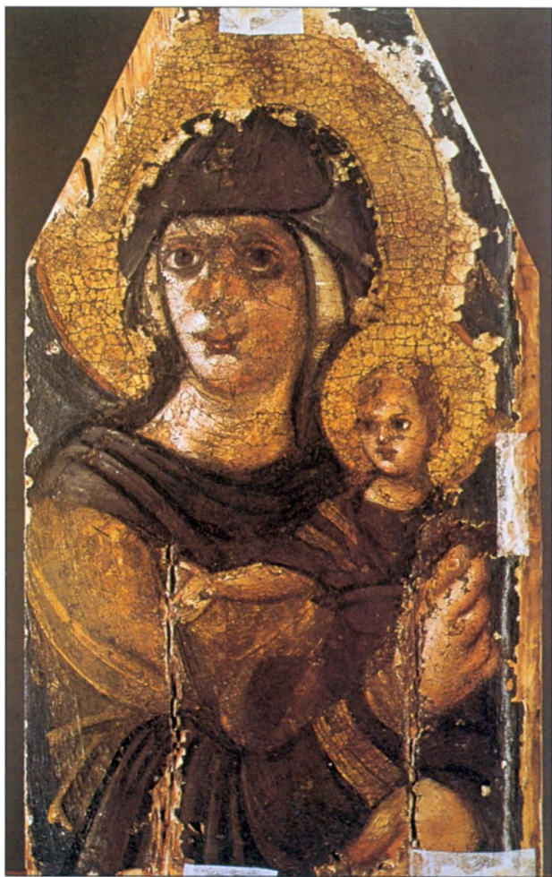
6. Εγκανστική εικόνα της Παρθένου με το Θείο Βρέφος, ΣΤ' αιώνας, από το Museum of Western and Oriental Arts, Κίεβο