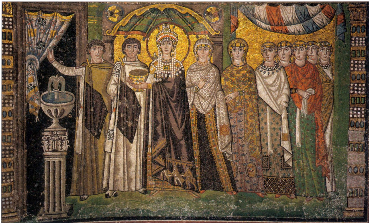
2. Ψηφιδωτό της Θεοδώρας και της Αυλής της, από τον σηκό του ναού του Αγίου Βασίλιου, Ραβένα, 5 τ αιώνας, αφιερωμένο το 547