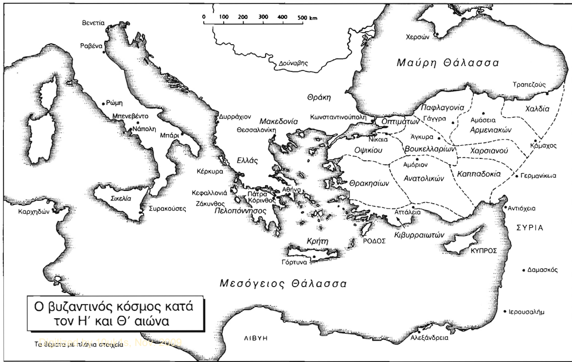
Ο βυζαντινός κόσμος κατά τον Η' και Θ' αιώνα