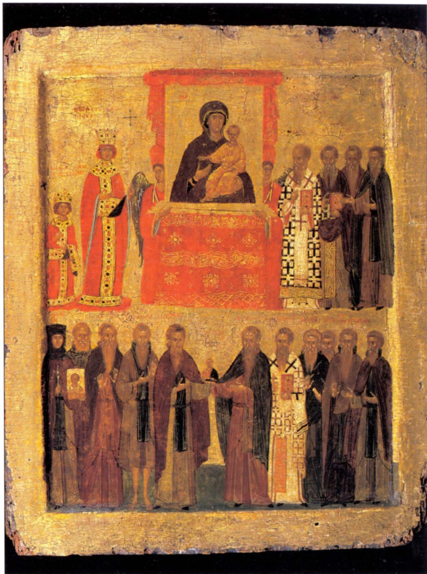
9. Η εικόνα του Θριάμβου της Ορθοδοξίας, Βρετανικό Μουσείο, με τη Θεοδώρα και τον Μιχαήλ Γ' (πάνω επίπεδο, αριστερά) και τον πατριάρχη Μεθόδιο (δεξιά) να περιβάλλουν την εικόνα της Οδηγήτριας με την Παρθένο και το Θείο Βρέφος. Στο κάτω επίπεδο εικονολάτρες άγιοι και μάρτυρες, στους οποίους περιλαμβάνεται η μυθική αγία Θεοδοσία (στην άκρη αριστερά) να κρατάει ένα μικρό εικόνισμα του Χριστού