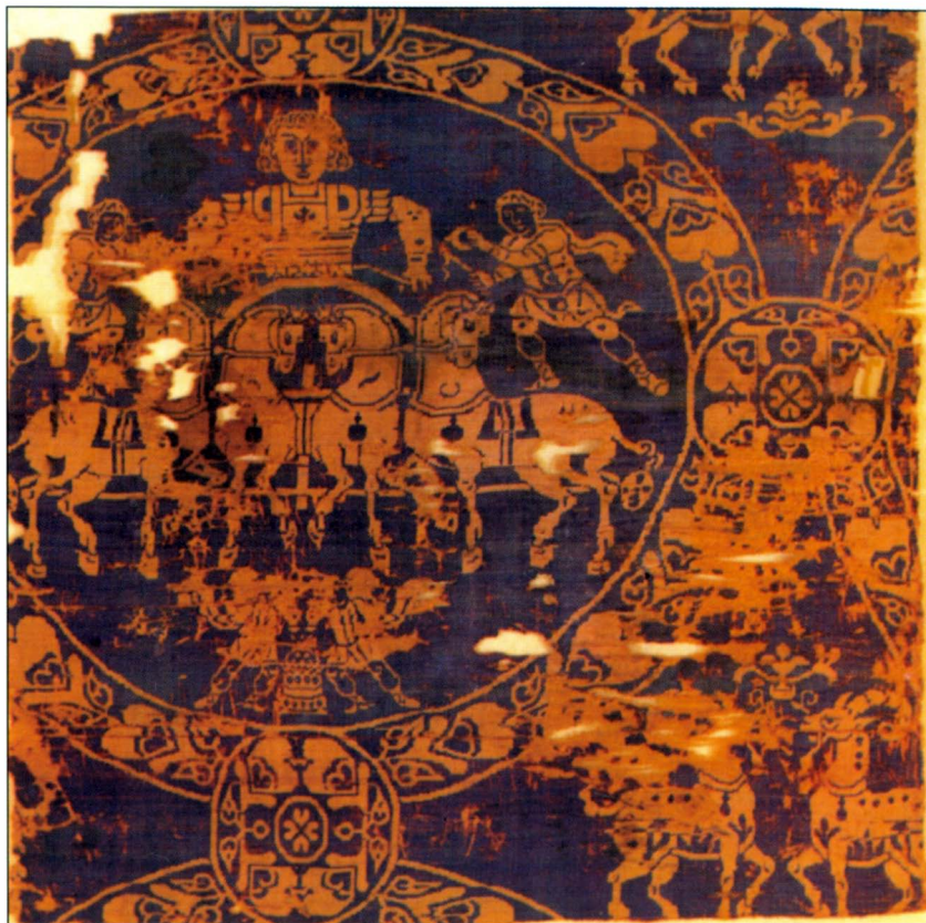
5. Μεταξωτή ενδυμασία αρματιλάτη, τέλη Η' αιώνα, από το Musée de l'Hôtel de Cluny, Παρίσι, η οποία χρησιμοποιήθηκε ως σάβανο όταν πέθανε ο Καρλομάγνος, το 814