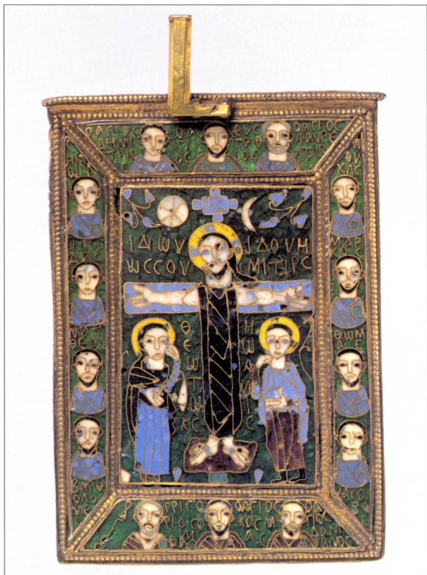
4. Η εμπρόσθια όψη της διακοσμημένης με σμάλτο Λειψανοθήκης Fieschi-Morgan, αρχές του Θ' αιώνα, Metropolitan Museum, Νέα Υόρκη (10,2 x 7,35 εκ.), απεικονίζει τη Σταύρωση με 14 αγίους οι οποίοι αναγνωρίζονται με τα ονόματά τους. Οι επίχρυσες επιγραφές επάνω από τη Μαρία, αποκαλούμενη Θεοτόκο, και τον Ιωάννη αναφέρουν: «Ιδού, ο υιός σου, Ιδού, η μήτηρ σου» (Ιωάννης, 19: 26-27)