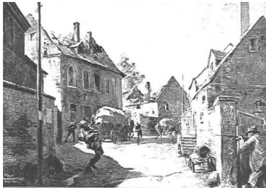
Απεικόνιση επίθεσης ελεύθερων σκοπευτών (francs-tireurs) εναντίον Γερμανών στρατιωτών από Γερμανό καλλιτέχνη. Φιλοτεχνήθηκε τον Αύγουστο του 1914