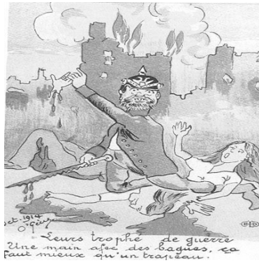
Γαλλική καρτ ποστάλ του Οκτωβρίου του 1914 που απεικονίζει το μύθο των «ακρωτηριασμένων χεριών»