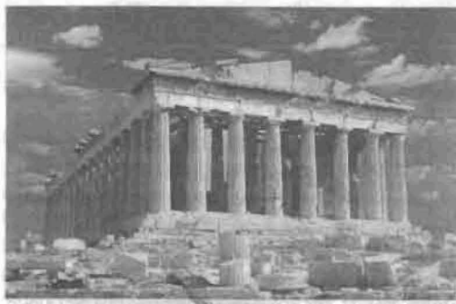
SOUVENIR OF ATHENS

Το κατάφεραν; Σε μεγάλο βαθμό ναι, αν κρίνουμε από την αντιμετώπιση του αρχαιολογικού χώρου από τους επισκέπτες του, από τους ξεναγούς, τις κάρτες και τις φωτογραφίες των τουριστών (πρβλ. Εικόνα 7). Ουσιαστικά, η διαδικασία αυτή μνημειοποίησης του χώ-