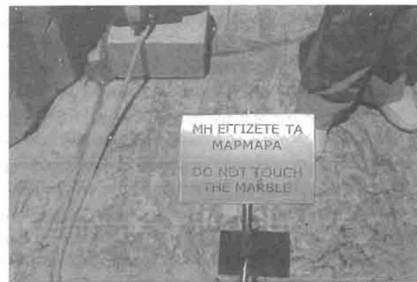
Εικόνα 3. «Μη εγγίζετε τα μάρμαρα». Από τα Προπύλαια της Ακρόπολης των Αθηνών (Ιούνιος 2007).

Η νεωτερική αρχαιολογία είναι επίσης ένας μηχανισμός που περιλαμβάνει την εκτεταμένη αναδημιουργία και ανοικοδόμηση, σχεδόν την εκ νέου παραγωγή του αρχαιολογικού αρχείου, όπως έδειξε η πλήρης αναστήλωση, αρχικά στη δεκαετία του 1830, του μικρού Ναού της Αιγέρου Νίκης στην Ακρόπολη (Hamilakis 2007, Μαλλούχου-Tufano 1998), μαζί με την αποκατάσταση πολλών άλλων μνημείων στον αρχαιολογικό χώρο και γύρω από αυτόν. 3 Πρωτίστως, η εθνική νεωτερική αρχαιολογία συλλέγει εκ νέου τα θραύσματα, κατασκευάζει ένα σύνολο, είτε ένα προϋπάρχον σύνολο μιας επιθυμητής χρονικής στιγμής, στην περίπτωση της αθηναϊκής Ακρόπολης τον 5ο π.Χ. αιώνα, είτε ένα φανταστικό σύνολο. Η Εικόνα 4 αποτελεί καλό παράδειγμα αυτής της διαδικασίας. Είναι μια αινιγματική εικόνα,