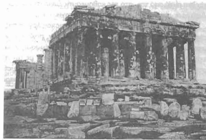
Εικόνα 2. Φωτογραφία του Felix Bonfils (τέλη της δεκαετίας του 1860 ή αρχές της δεκαετίας του 1870) που απεικονίζει τον Παρθενώνα από τα δυτικά (Συλλογή Φωτογραφιών του Felix Bonfils. Βιβλιοθήκη του Πανεπιστημίου του Πρίνστον. Αναπαραγωγή έπειτα από ειδική άδεια).