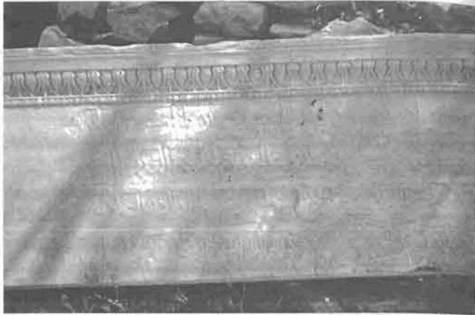
Εικόνα 8. Ένα αρχιτεκτονικό θραύσμα από τον κλασικό ναό του Ερεχθείου με επιγραφή στα οθωμανικά τουρκικά.

η φωτογραφία και ποιας εποχής είναι το κομμάτι που απεικονίζει: Το κομμάτι αυτό ενσωματώνει με πλούσιο αλλά σαφή και περιεκτικό τρόπο πολλά από τα θέματα που ανέπτυξα στο παρόν άρθρο. Διακόπτει την κατασκευασμένη μοναδική χρονικότητα του παρόντος, καθώς και τη χρονικότητα της κλασικής αρχαιότητας, φέρνοντας στο προσκήνιο τη χρονικότητα της οθωμανικής ζωής της Ακρόπολης. Κάνει, όμως, πολύ περισσότερα. Αποτελεί την αντίσταση της υλικότητας, μιας υλικότητας που αντέχει και υπομένει, παρά τις ποικίλες διαδικασίες εκκαθάρισης, αναδημιουργίας και φωτογραφικής μνημειοποίησης. Εμπειρεύει υλική ενέργεια και δύναμη: τη δύναμη και την ικανότητα των πραγμάτων (και όχι των ατόμων) να επεμβαίνουν στο παρόν 10 και να διαρρηγνύουν τη χρονική, και σε αυτή την περίπτωση, την υλική, την αναπαραστατική, τη μνημειακή και την αρχαιολογική συναίνεση.