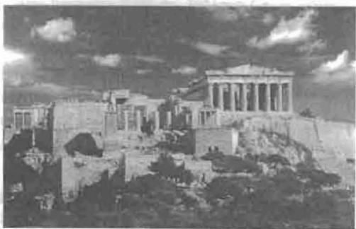
Εικόνα 7. Κάρτα που αγόρασε ο συγγραφέας στην είσοδο της Ακρόπολης τον Ιούνιο του 2007.