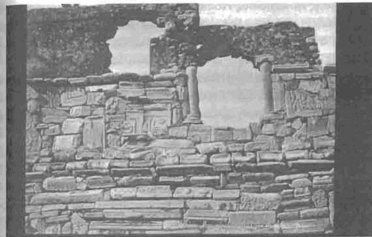
Εικόνα 4. Φωτογραφία του Bonfils (τέλη της δεκαετίας του 1860 ή αρχές της δεκαετίας του 1870) που δείχνει έναν τεχνητό τοίχο, πιθανότατα από τον πρώτο έλληνα αρχαιολόγο, τον Κ. Πιττάκη (Συλλογή Φωτογραφιών του Felix Bonfils. Τμήμα Χειρογράφων. Τμήμα Σπάνιων Βιβλίων και Ειδικών Συλλογών. Βιβλιοθήκη του Πανεπιστημίου του Πρίνστον. Αναπαραγωγή έπειτα από ειδική άδεια).