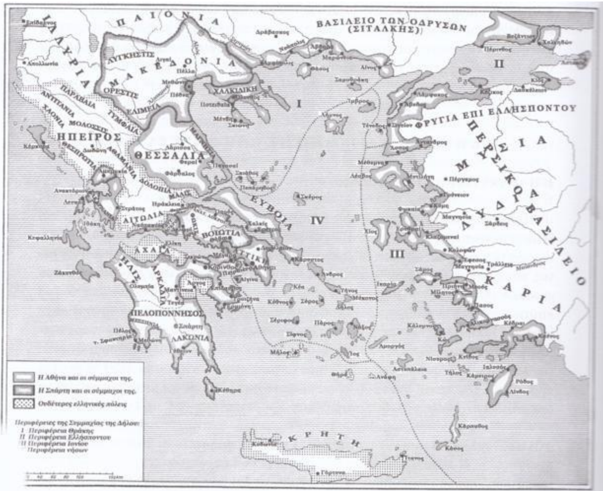
Εικ. 1. Οι γεωγραφικές περιοχές της Ελλάδας κατά τον 4 αι. π.Χ.

Το ίδιο έτος διεξάγεται το συνέδριο της Κορίνθου από το Φίλιππο, με σκοπό τη απόκτηση της υποστήριξης των Ελλήνων για τον νικητή, ο οποίος ασχολείται τώρα με τις προετοιμασίες για την εκστρατεία κατά της Περσίας που σχεδιάζει. Το 336 π.Χ., όμως, δολοφονείται, με αποτέλεσμα ο Αλέξανδρος να ενθρονισθεί και να διορισθεί στρατηγός της εκστρατείας κατά της Περσίας, η οποία αρχίζει το 334 π.Χ.