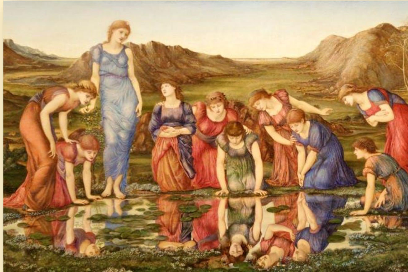
Edward Burne- Jones, Ο καθρέπτης της Αφροδίτης